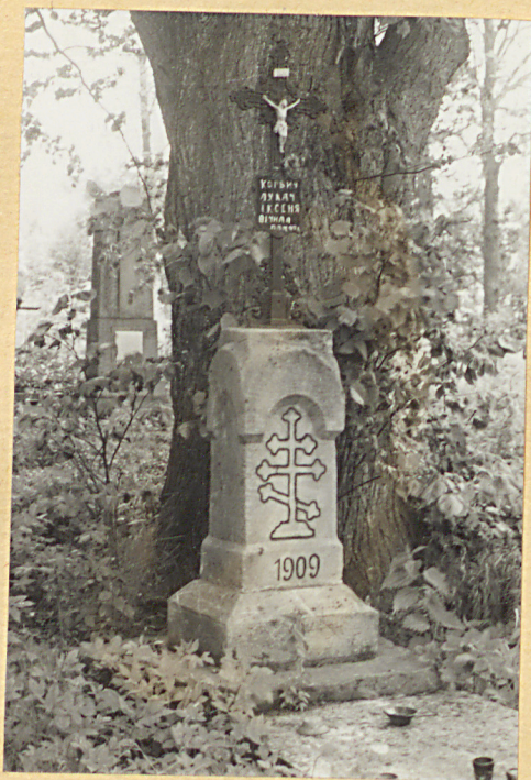
2. Nagrobek z krzyżem żel. Korbicz Łukasz + 1909r.