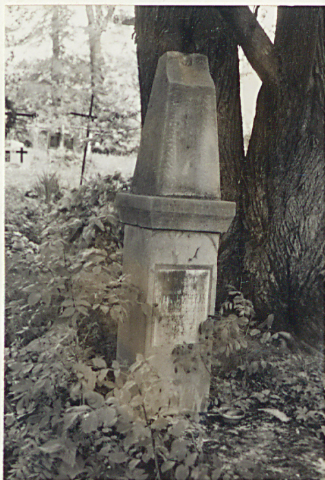
5. Nagrobek - Gonorata Kołystjanskaja + 1904r.