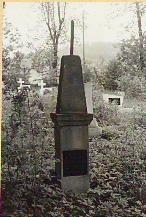
3. Nagrobek - Aleksandra Albinowska + 1901r.