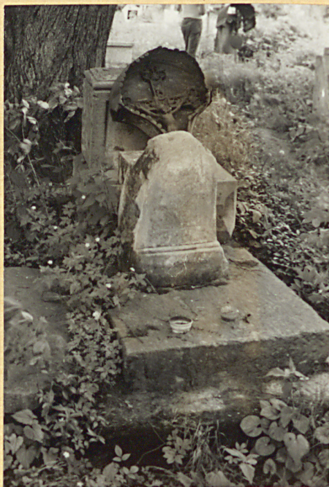
4. Nagrobek uszkodzony z pocz.XX w./napisów brak/