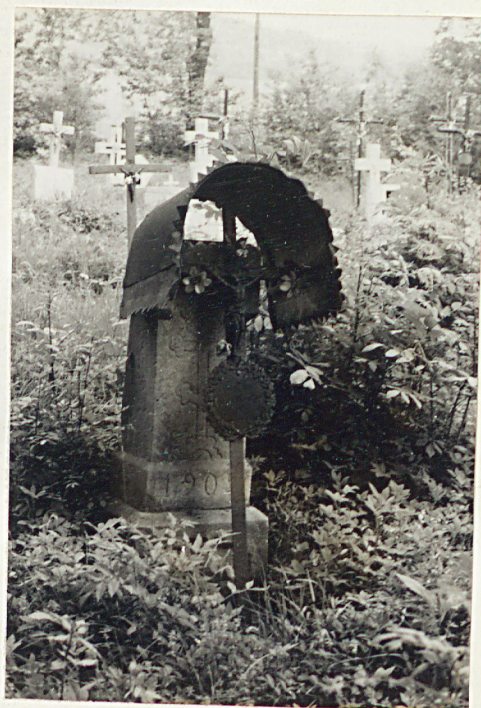
6. Nagrobek uszkodzony z 1902r./napis nieczytelny/