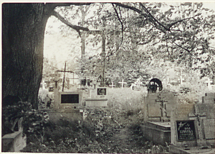
7. Widok ogólny