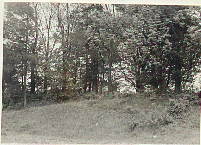
8. Widok ogólny