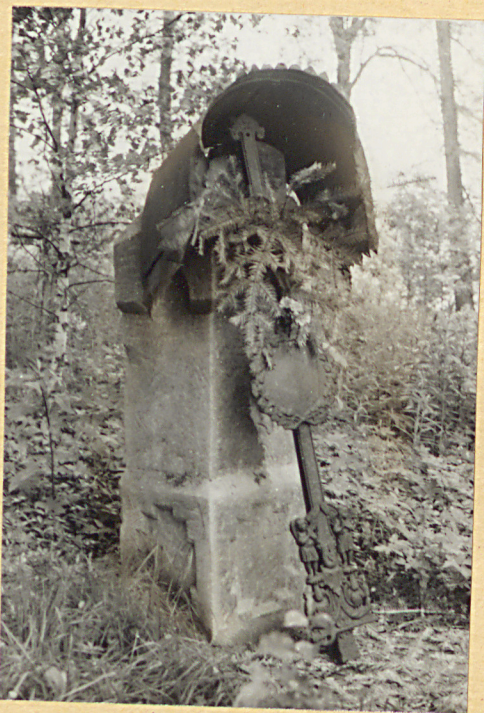
1. Uszkodzony nagrobek z 1902r./napisów brak/