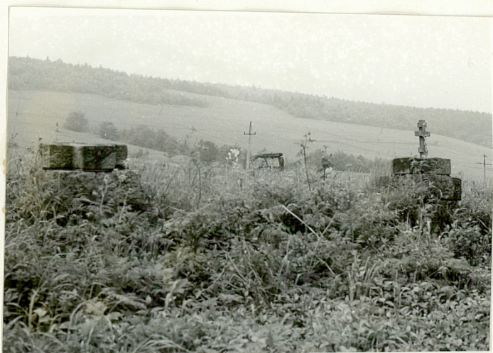
7. Widok ogólny