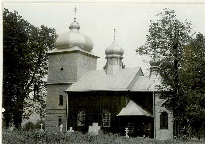
6. Cerkiew drewniana