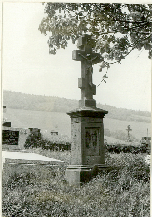
5. Krzyż kamienny z 1908r. /napis nieczytelny/