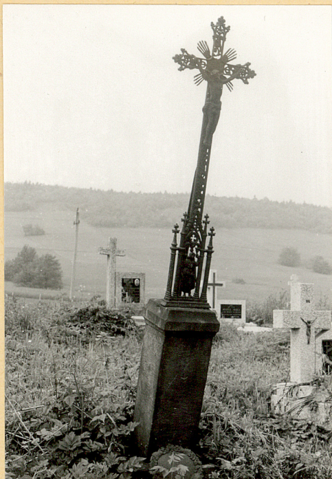
1. Nagrobek z krzyżem żel. z k.XIX w.