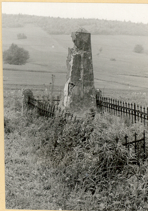
2. Obelisk betonowy z ogrodzeniem ..... śenty Wilis z 1900r.