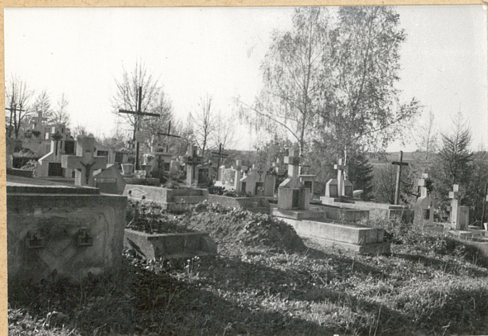
1. Widok, ogólny