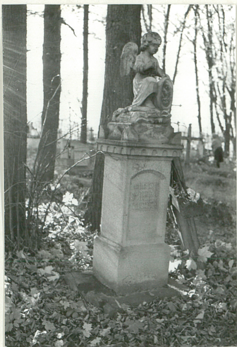
9. Nagrobek kamienny Józef Nigbor k. XIX w.