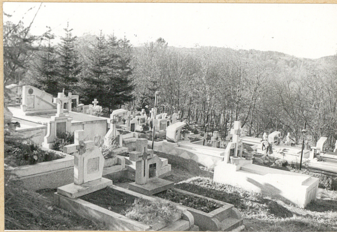
2. Widok ogólny