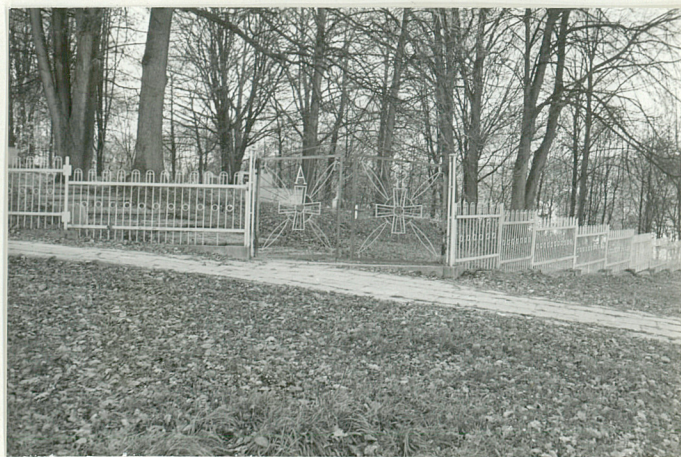
12. Widok ogólny