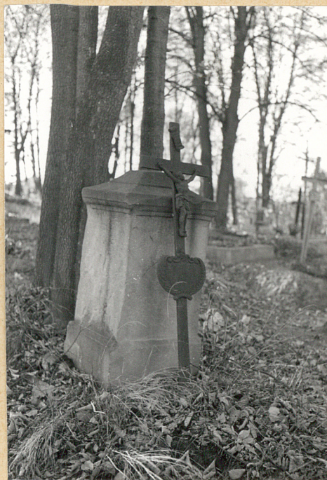
4. Nagrobek z krzyżem żel. z k. XIX w. (napisów brak)