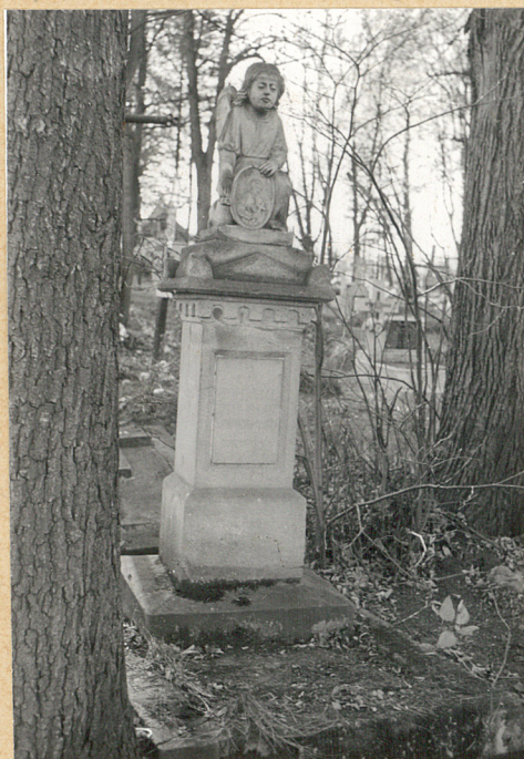
3. Nagrobek z figurą kam. Stasiu ..... + 1902r.