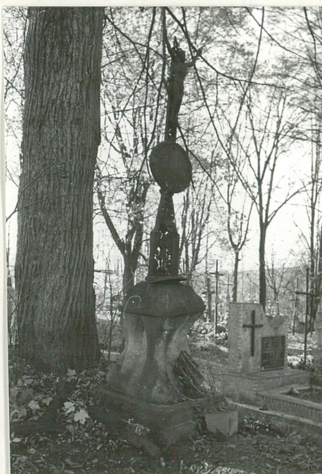
7. Nagrobek z krzyżem żel. k. XIX w. (napisów brak)