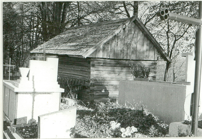
13. Drewniany budynek gospodarczy