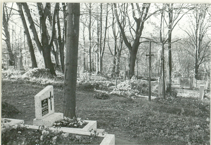
11. Widok ogólny