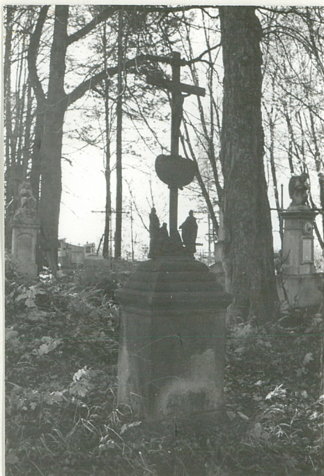
5. Nagrobek z krzyżem żel. k. XIX w. (napisów brak)