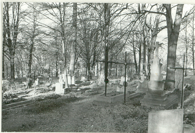
10. Widok ogólny