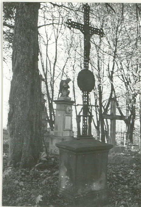
6. Nagrobek z krzyżem żel. k. XIX w. (napisów brak)