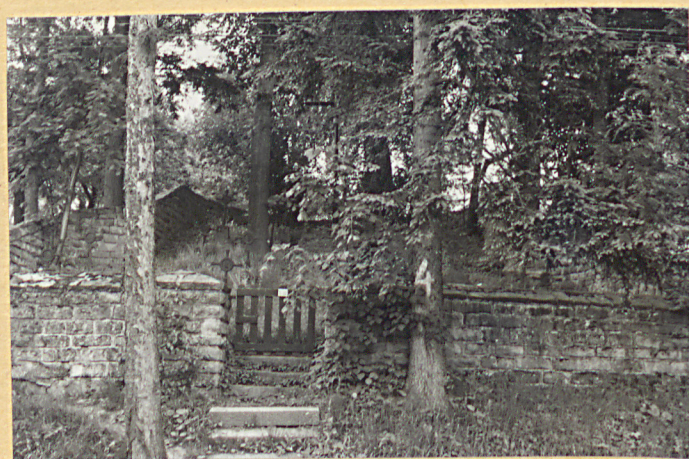
4. Furtka cmentarna