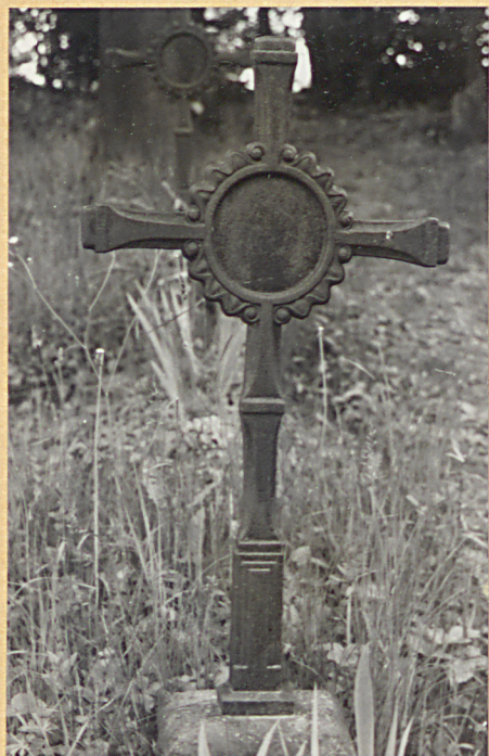
1. Krzyż żel.