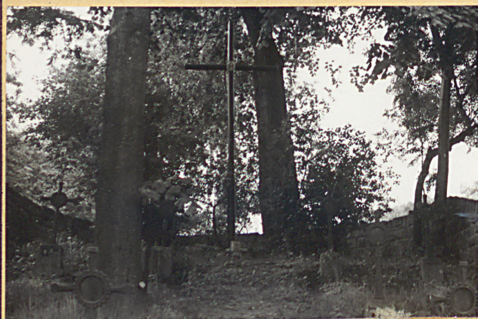
3. Widok ogólny