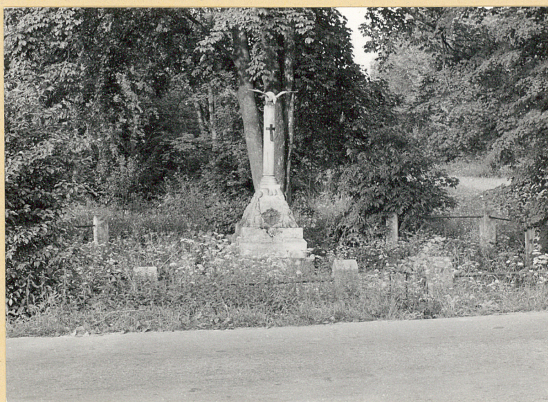
3. Widok z szosy