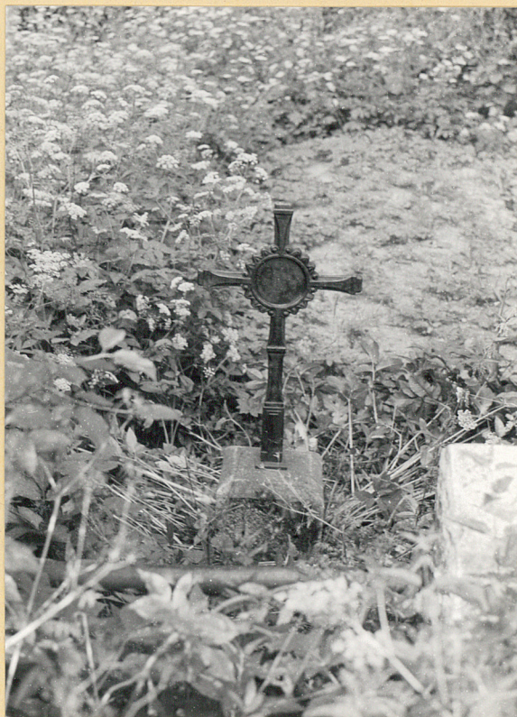
2. Krzyż żeliwny