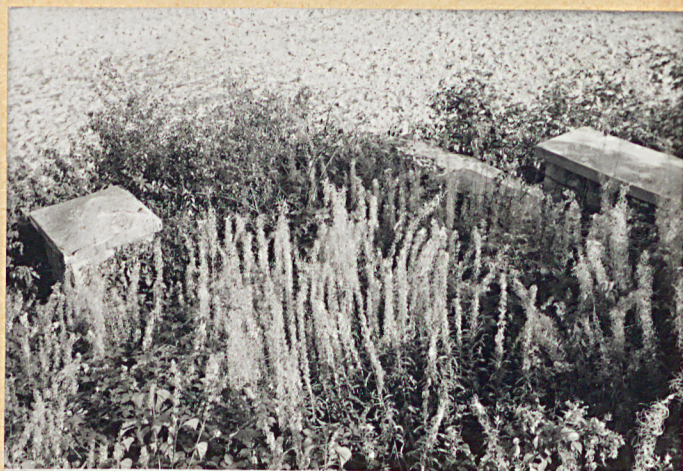
2. Widok ogólny