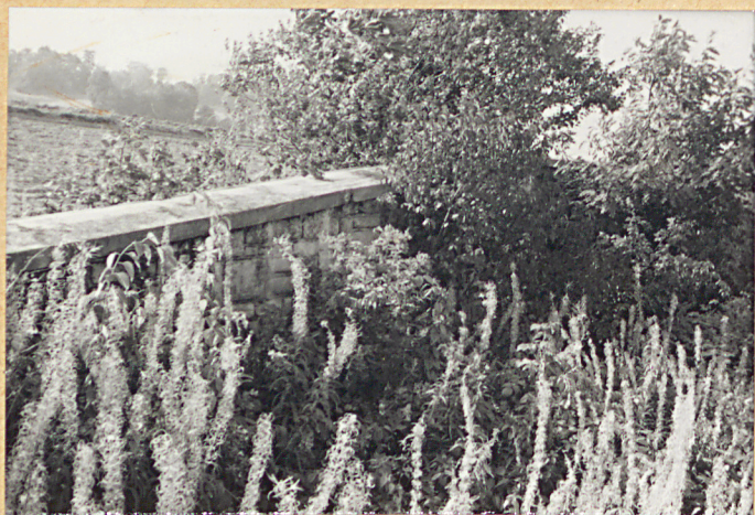
1. Widok ogólny