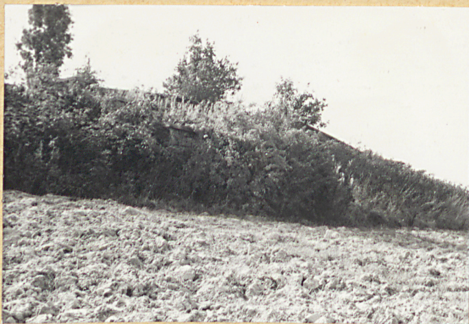
3. Widok ogólny