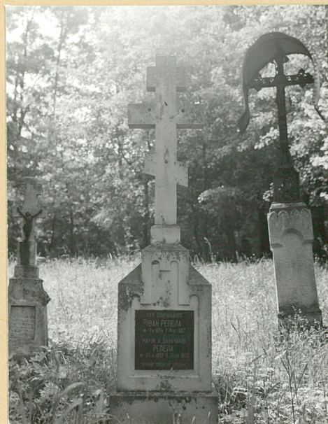
9. JWAN 1907 MARIA 1937 RIEPIELA