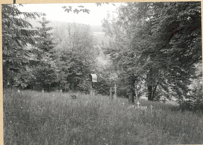
4. WIDOK OGÓLNY STRONY PN.