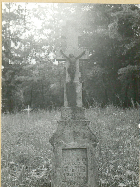
10. ANASTAZIA RIECEVOKA 1914