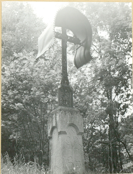
8. NN 1899