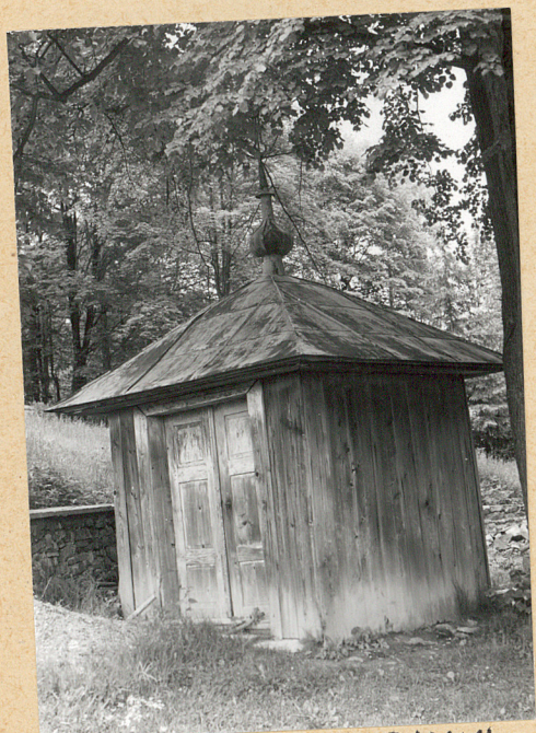
2. BUDOWLA PRZY CERKWI