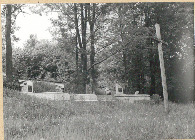
5. WSPÓŁCZESNE GROBOUCE W STRONIE WSCH.