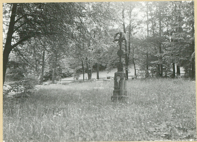
7. NAGROBEK 1908 W STR. ŚRODK.-PN.