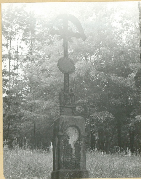
6. NN 1908