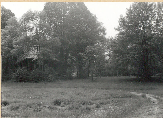
1. WIDOK Z DROGI