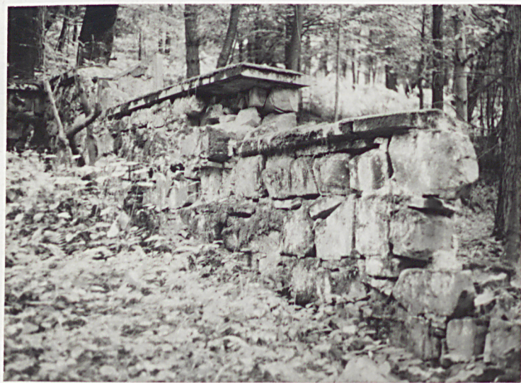
12. FRAGMENT ZNISZCZONEGO MURU