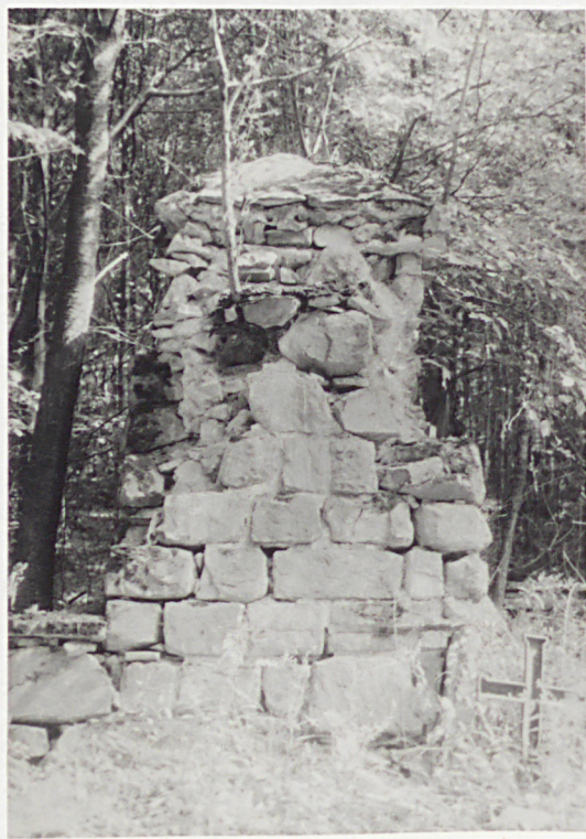
11. ŚCIĘPIE NAROŻNE