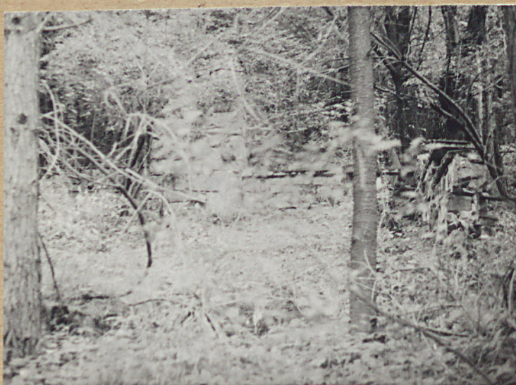
4. WIDOK OD WEJŚCIA