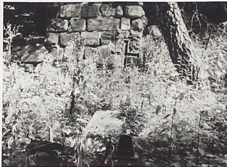
9-10. STRONA PRZY ŚCIĘPIE NAROŻNYM