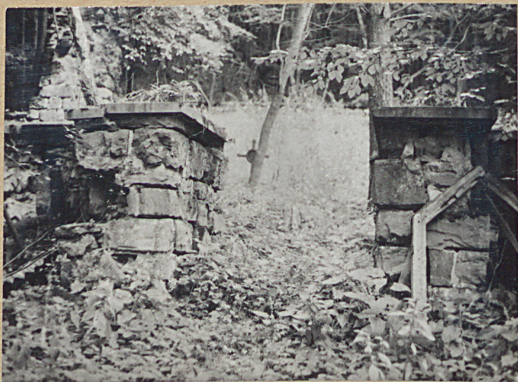
1. WEJŚCIE NA CMENTARZ