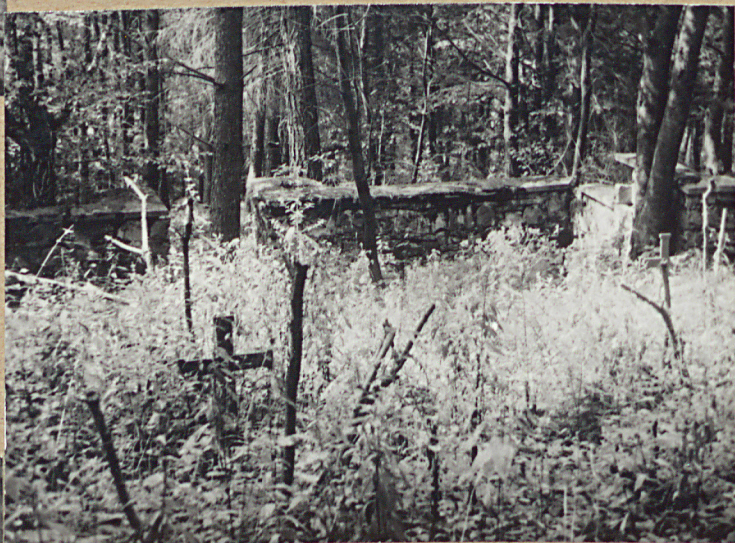
3-3 STRONA CMENTARZA PRZY WEJŚCIU