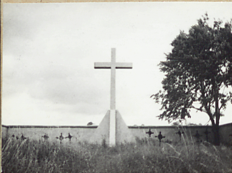
5. STRONA POŁUDNIOWA