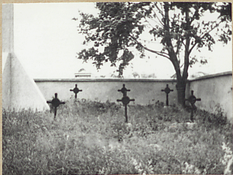
3. STRONA PRAWA ŚCIANY POŁUDNIOWEJ