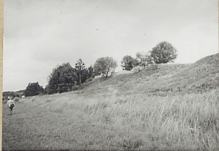
1. WIDOK OD STRONY PÓŁNOCNO-ZACHODNIEJ