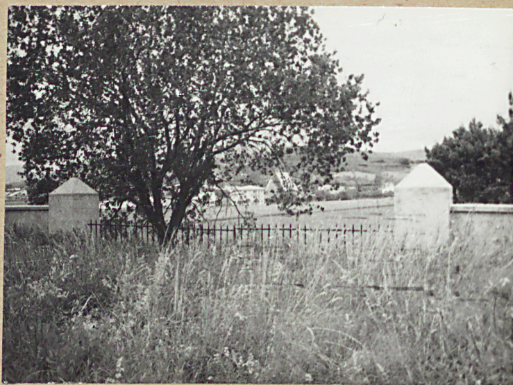
2. BRAMKA WĘSCIOWA