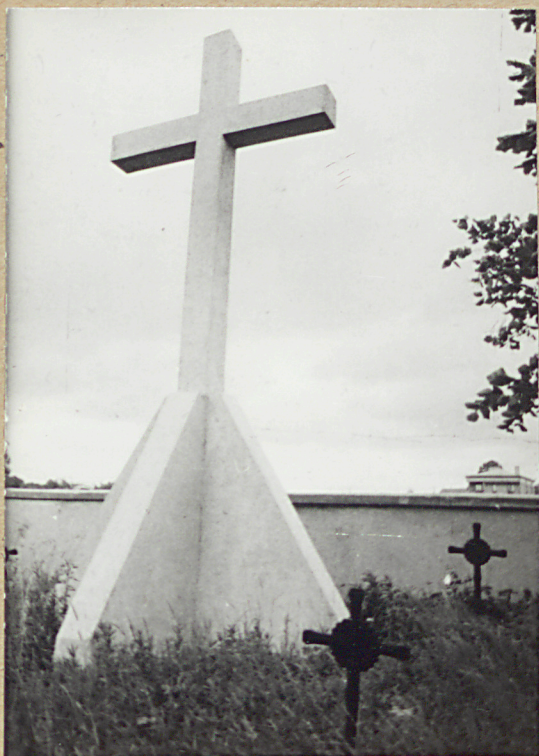
4. KRZYŻ - OBELISK