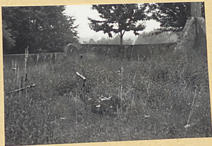
3. Widok ogólny