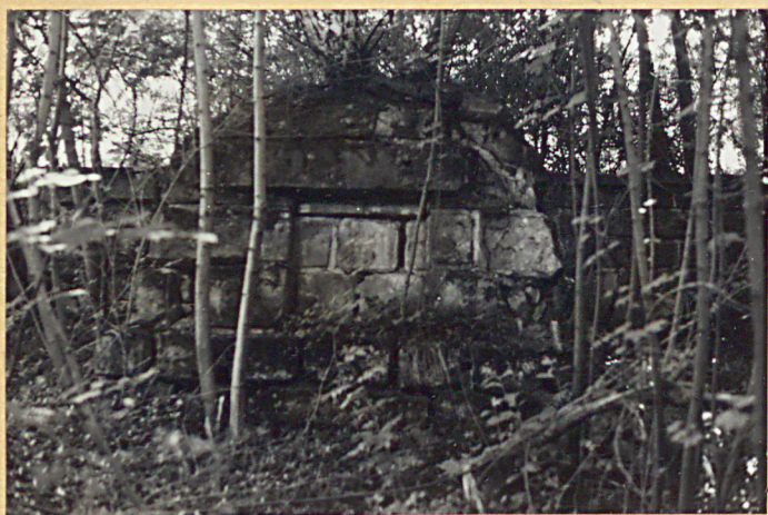
1. Pomnik mur.