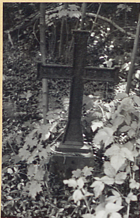
2. Krzyż żeliwny