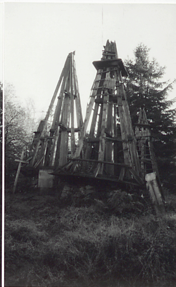
10. WIEŻE, W GŁĘBI-TABLICA