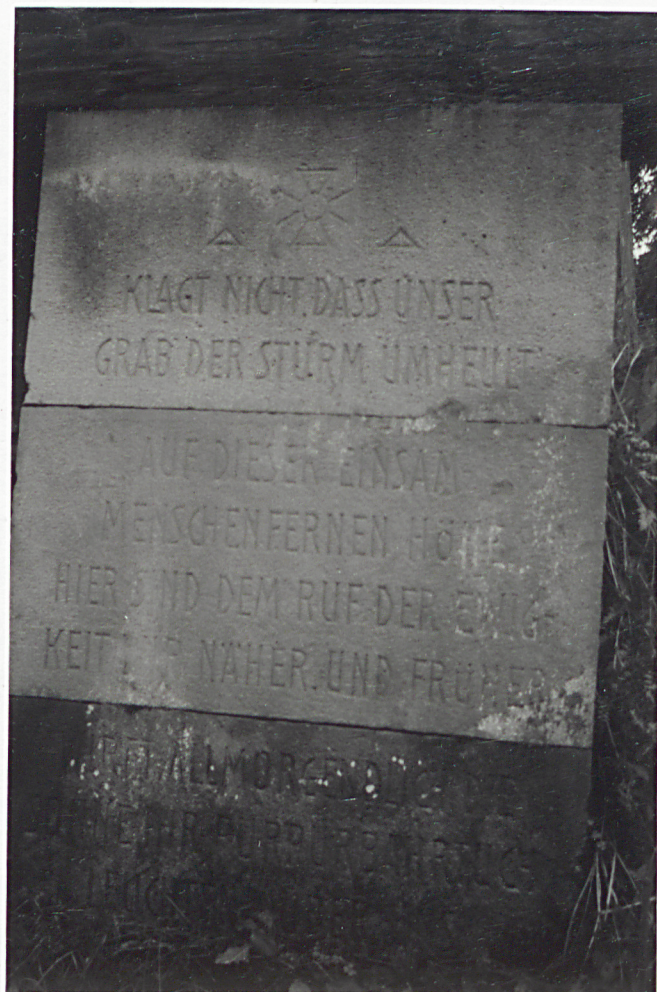
12. TABLICA Z INSKRYPCJĄ