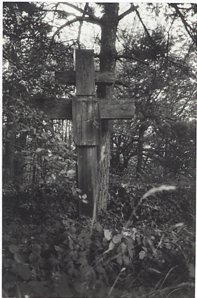
11. KRZYŻ NA MOGILE ŻOŁNIERZY ROSYJSKICH