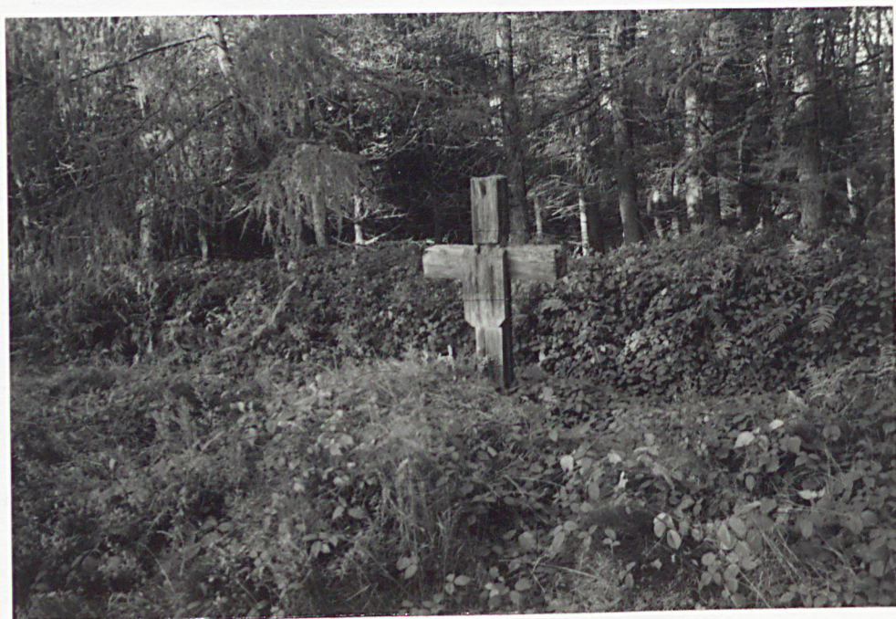
13. MOGIŁY W STRONIE PÓŁNOCNEJ