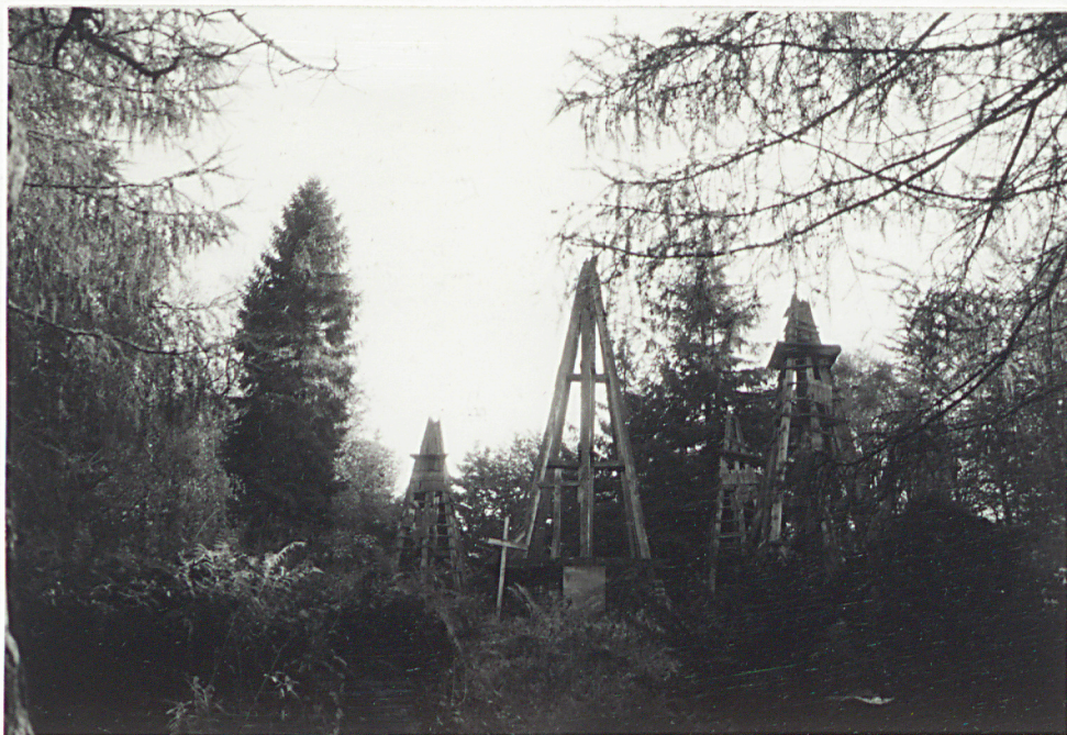
4. WIDOK WNEŹRZA OD WEJŚCIA