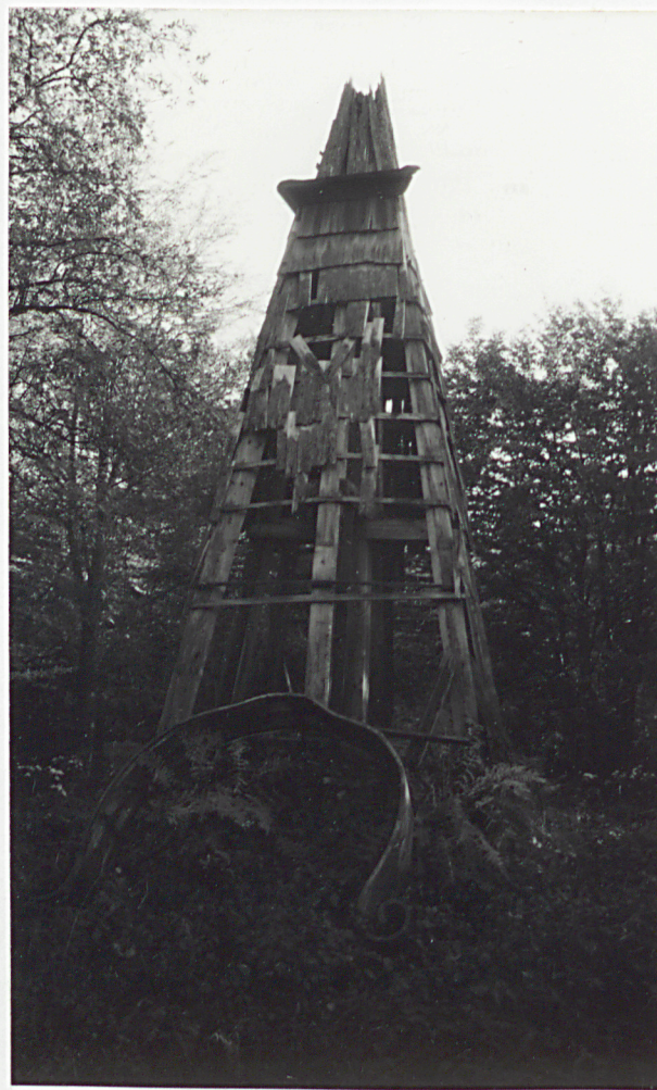
9. WIEŻA ŻRODKOWA