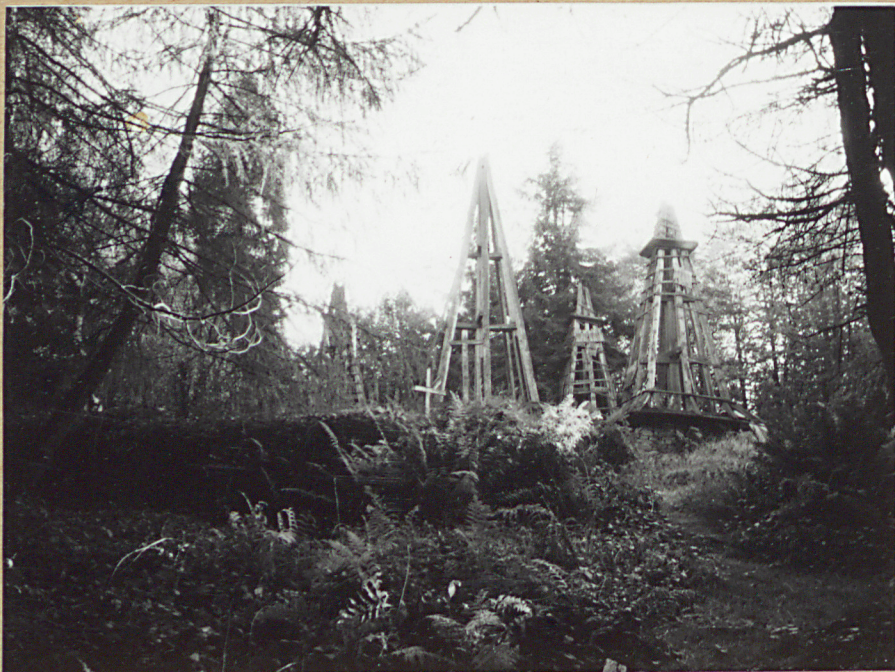
2. WIDOK OD POŁNOCY SPOD BUNKRA