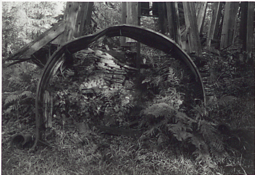
8. DASZEK WIEŻY