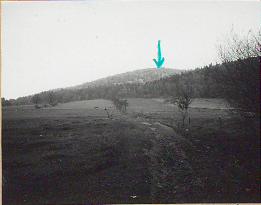
1. WIDOK NA ROTUNDĘ Z REGETOWA