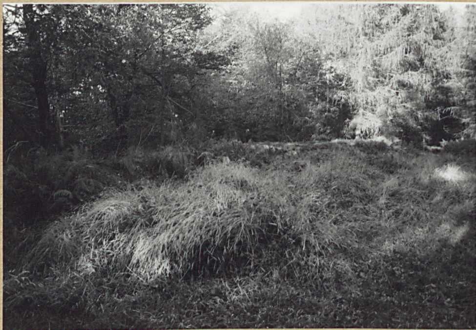
3. WNETRZE - MOGIŁY ZIEMNE