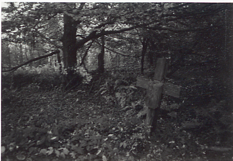
14. KRZYŻE NA MOGIŁACH NA OBWODZIE MURU