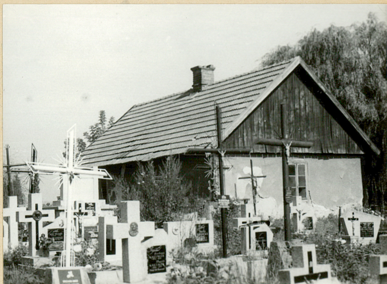
12. DOMEK GOSPODARCZY