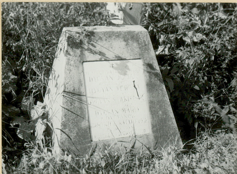
7. JULIAN DYCAN 1922