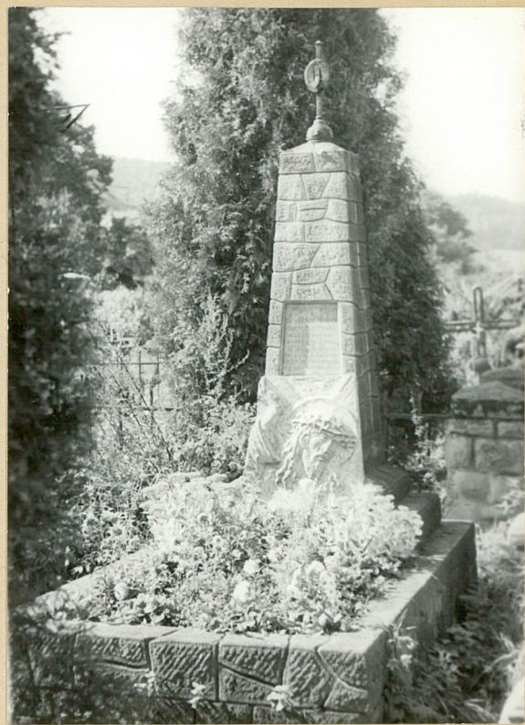
10. KS. ANDRZEJ GOŁĄB 1936