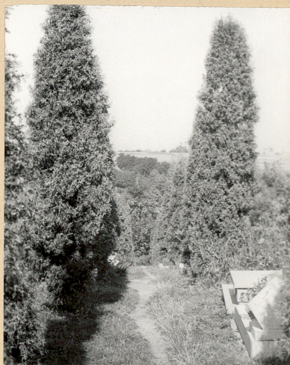
2. ALEJA TUIOWA W STRONĘ PN.