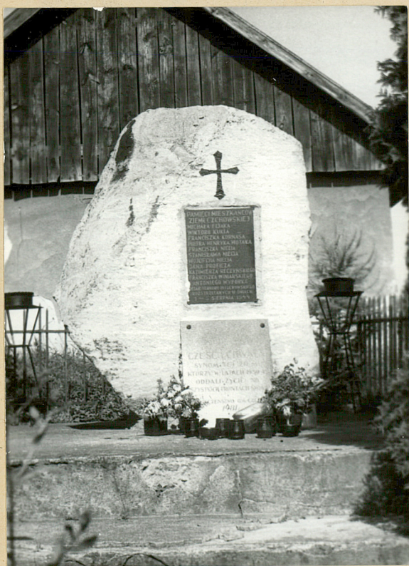
11. POMNIK KU CZCI POLEGŁYCH MIESZKAŃCÓW ZIEMI CZCHOWSKIEJ 1939-1945