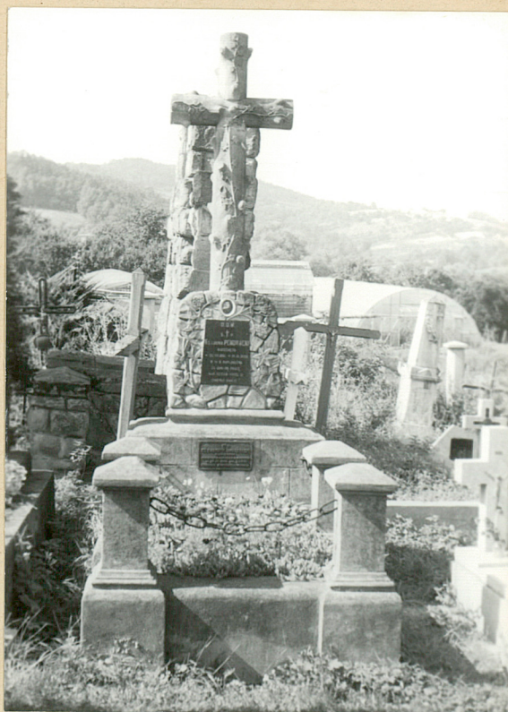
8. Ks. LUDWIK PENDRACKI 1930