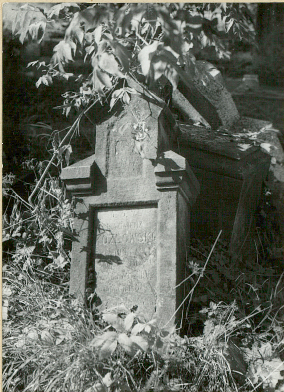
5. KAZIMIERZ KOZŁOWSKI 1905