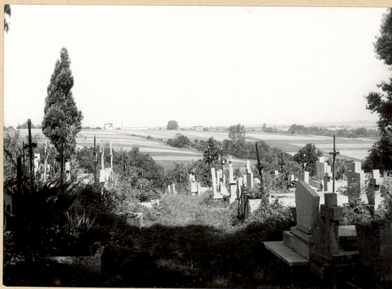
4. ALEJA W STRONIE Wsch. UK.