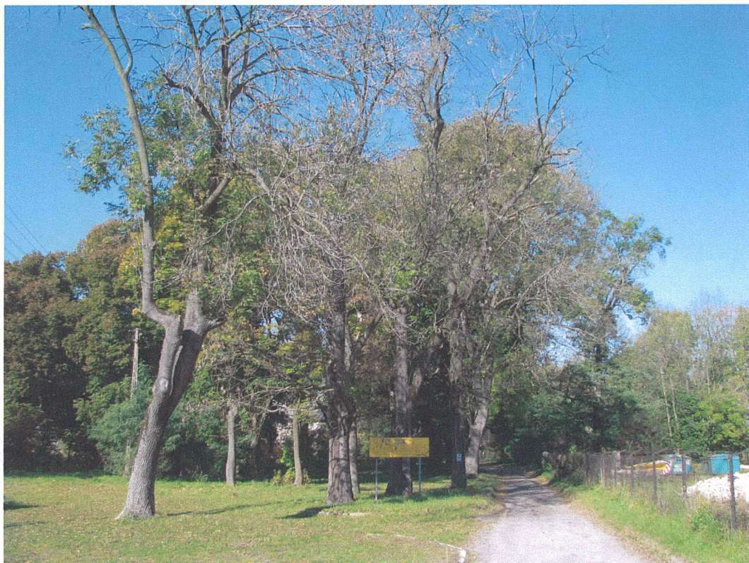
Fot.1. Siemkowice. Aleja dojazdowa do parku i dworu od strony południowej