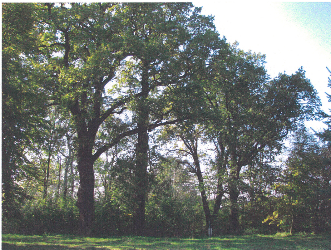
Fot.16. Siemkowice. Widok na trzy dęby pomnikowe (pierśnice: 150 cm, 146 cm, 127 cm) w zachodniej części parku widziane od strony wschodniej