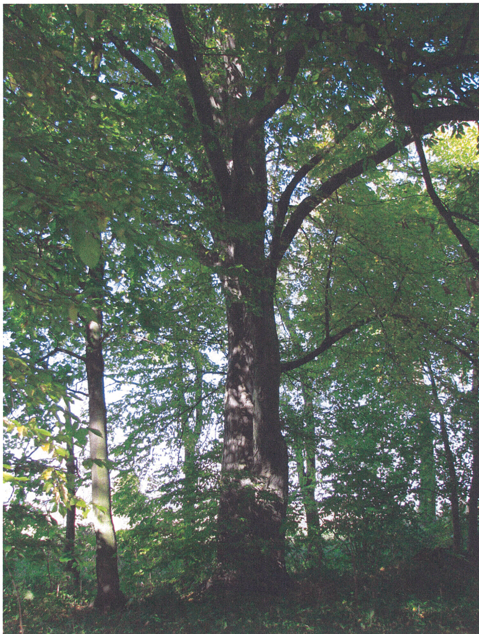
Fot.20. Siemkowice. Pomnikowy grab (pierśnica 93 cm) w północnej części parku widziany od strony południowej