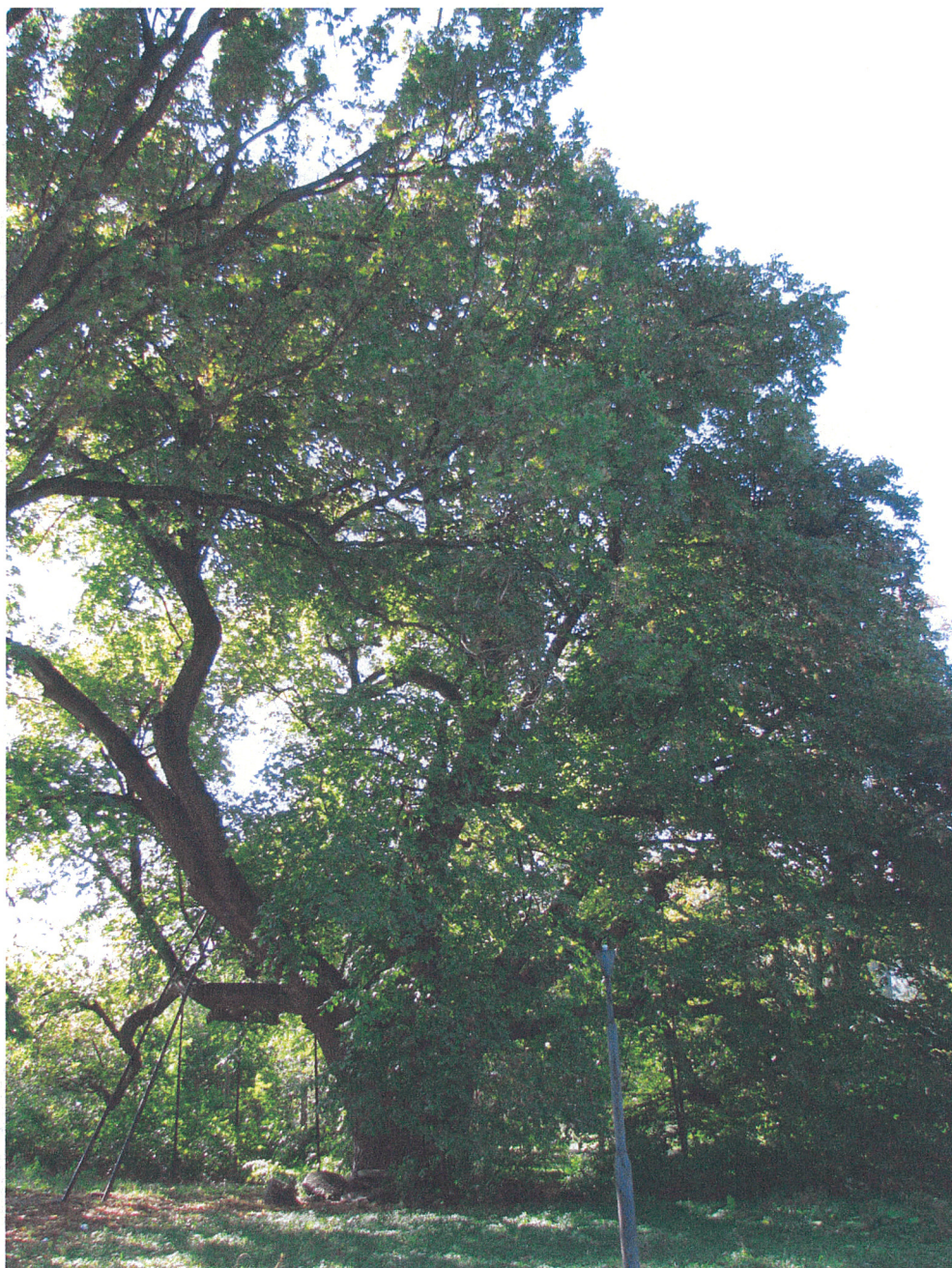
Fot.3. Siemkowice. Pomnikowa lipa szerokolistna (pierśnica 220 cm, a obwód 765 cm) we wschodniej części parku widziana od strony wschodniej