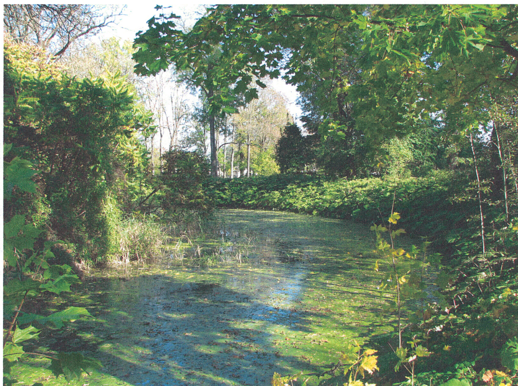
Fot.10. Siemkowice. Układ wodny będący pozostałością po fosie wokół wyspy z dworem obronnym