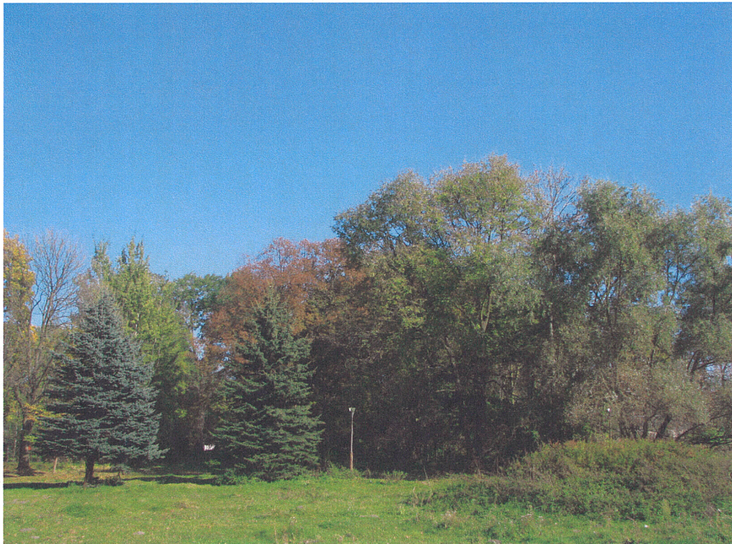
Fot.17. Siemkowice. Widok na centralną część parku od strony zachodniej, w tle pomnikowa lipa szerokolistna