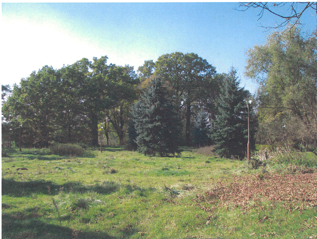
Fot.12. Siemkowice. Widok na centralną i zachodnią część parku