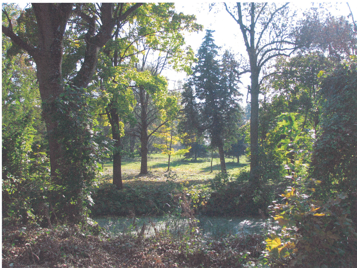
Fot.22. Siemkowice. Panorama parku widziana od strony dworu w kierunku południowym