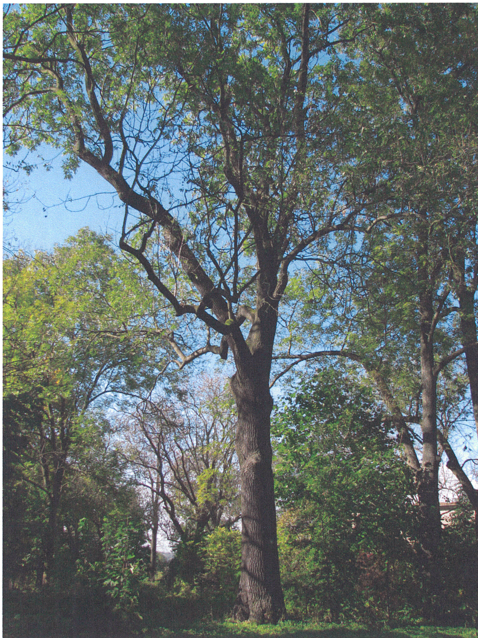
Fot.4. Siemkowice. Pomnikowy jesion wyniosły (pierśnica 108 cm) we wschodniej części parku