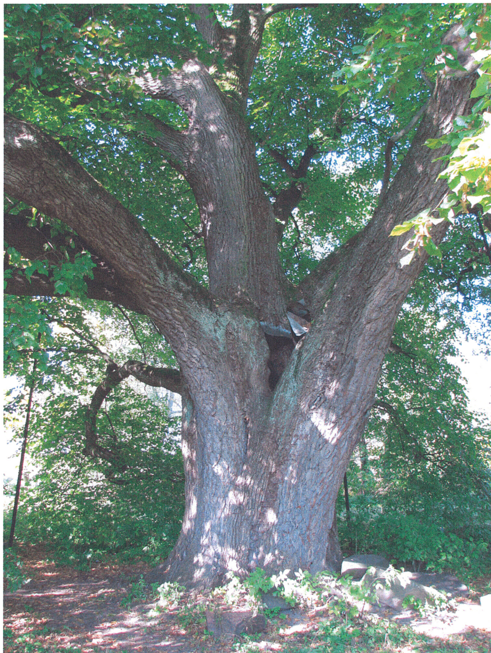
Fot.11. Siemkowice. Pomnikowa lipa szerokolistna (pierśnica 220 cm, a obwód 765 cm) we wschodniej części parku widziana od południa