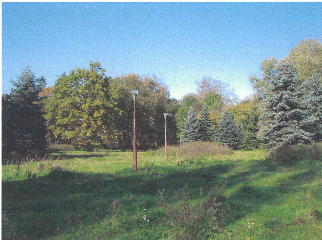
Fot.13. Siemkowice. Widok na centralną część parku od strony południowej