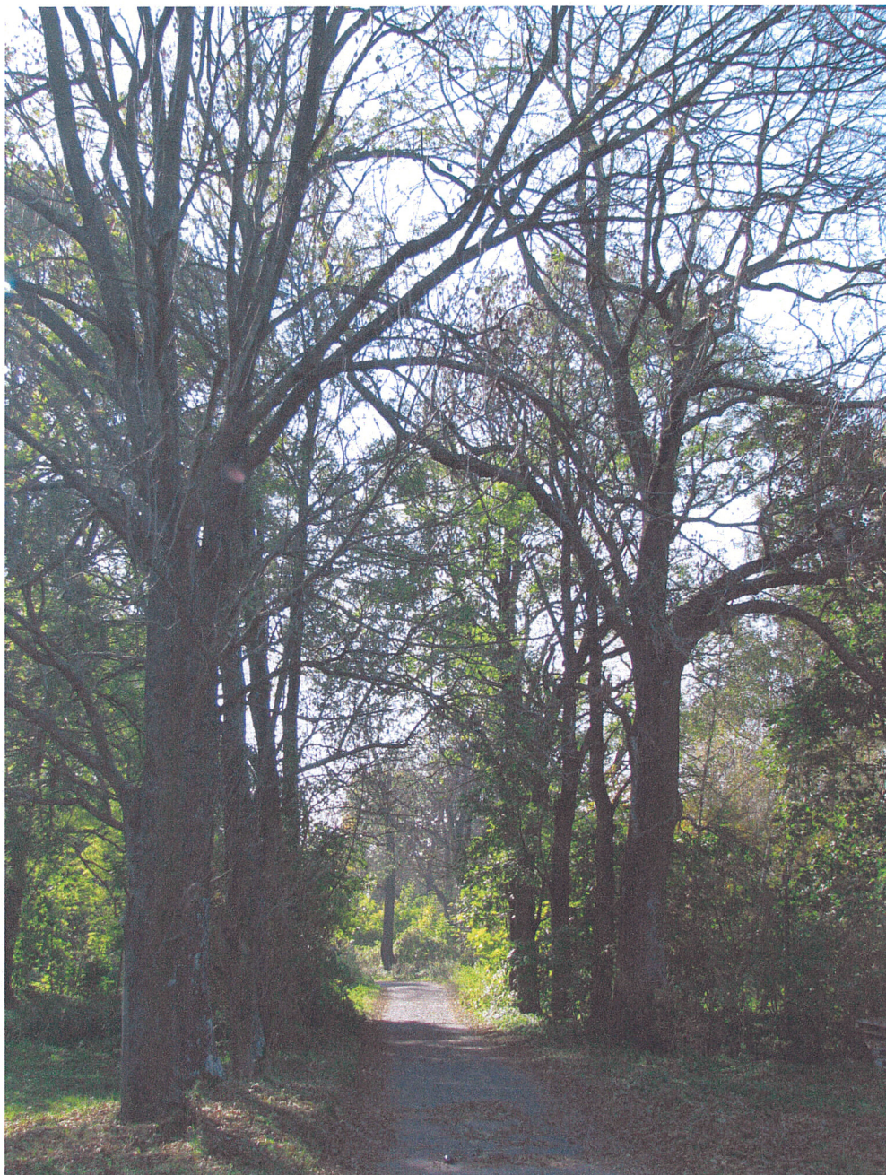
Fot.7. Siemkowice. Aleja wjazdowa od strony północno-wschodniej