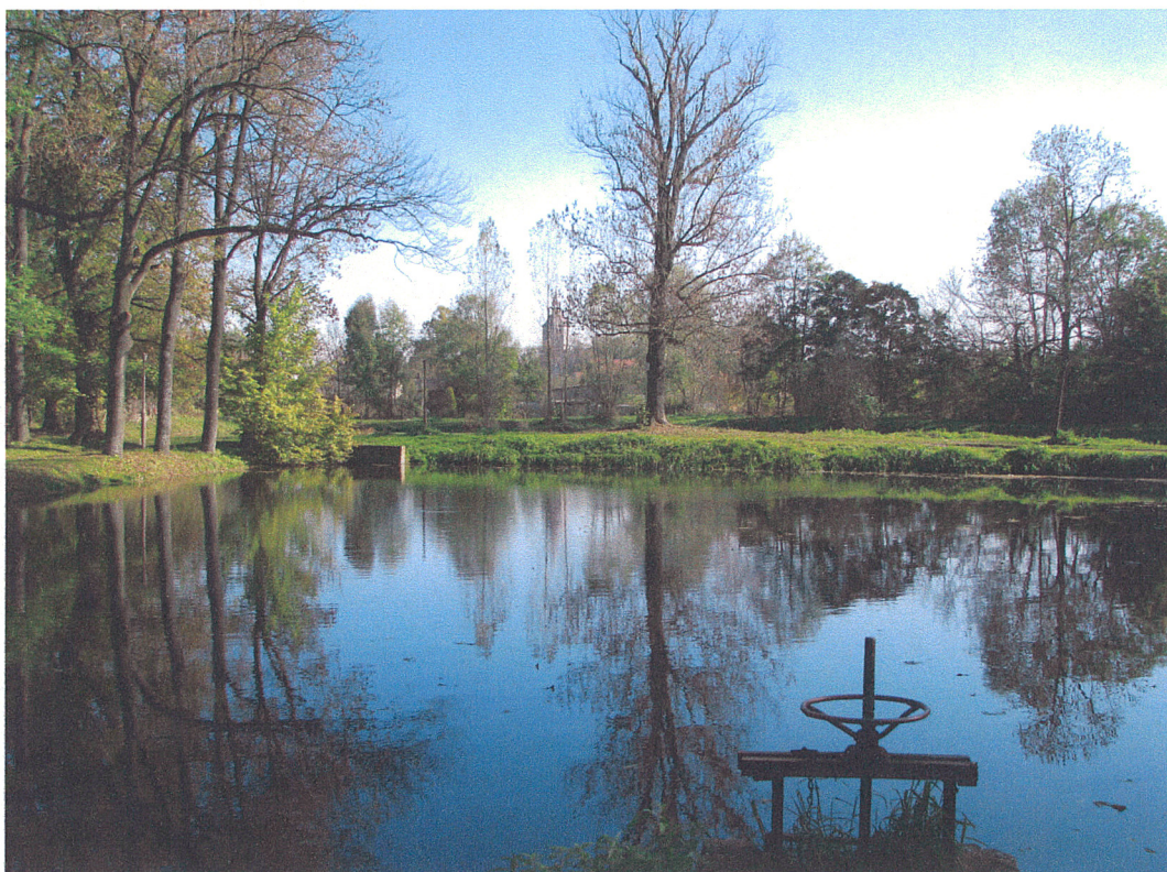
Fot.6. Siemkowice. Widok na mniejszy staw we wschodniej części parku