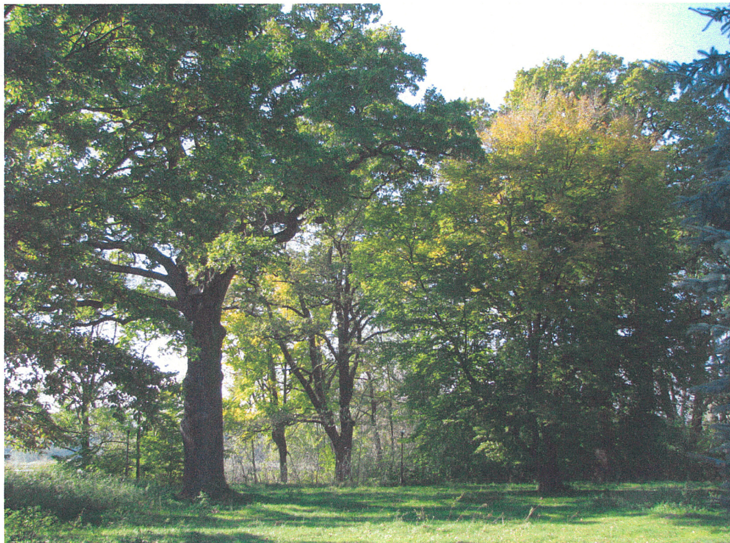
Fot.15. Siemkowice. Pomnikowy dąb (pierśnica 163 cm) w zachodniej części parku widziany od strony wschodniej