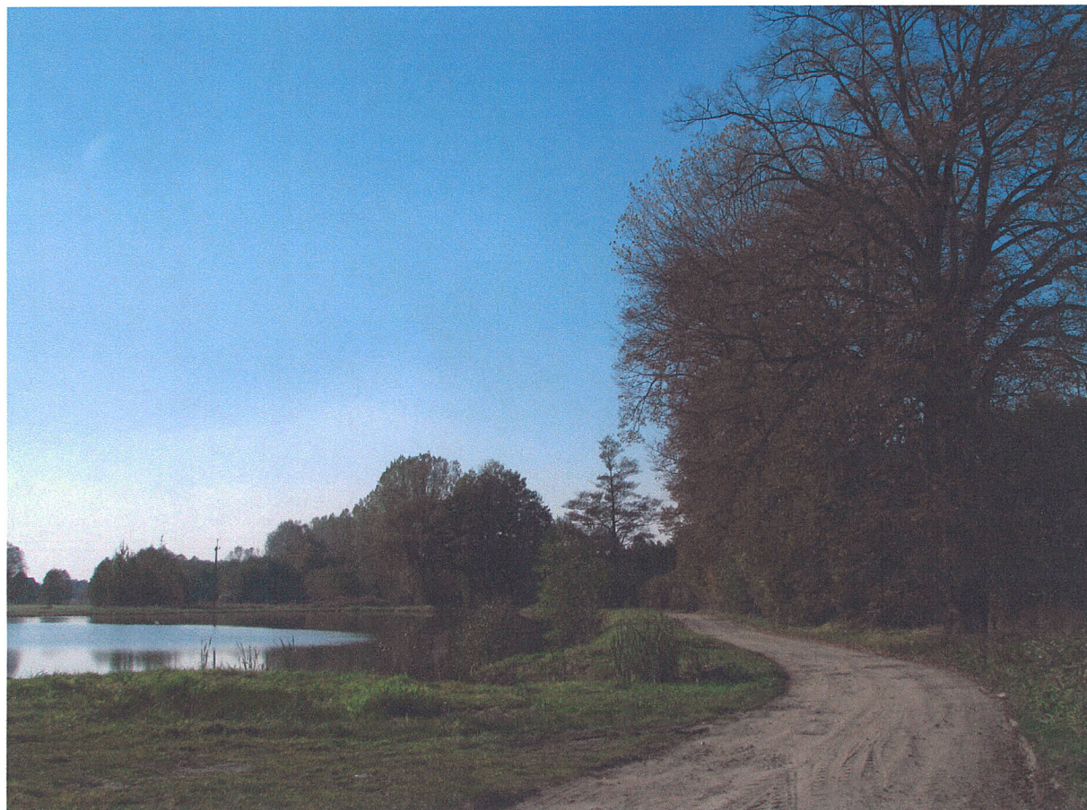
Fot.19. Siemkowice. Duży staw widziany od strony wschodniej