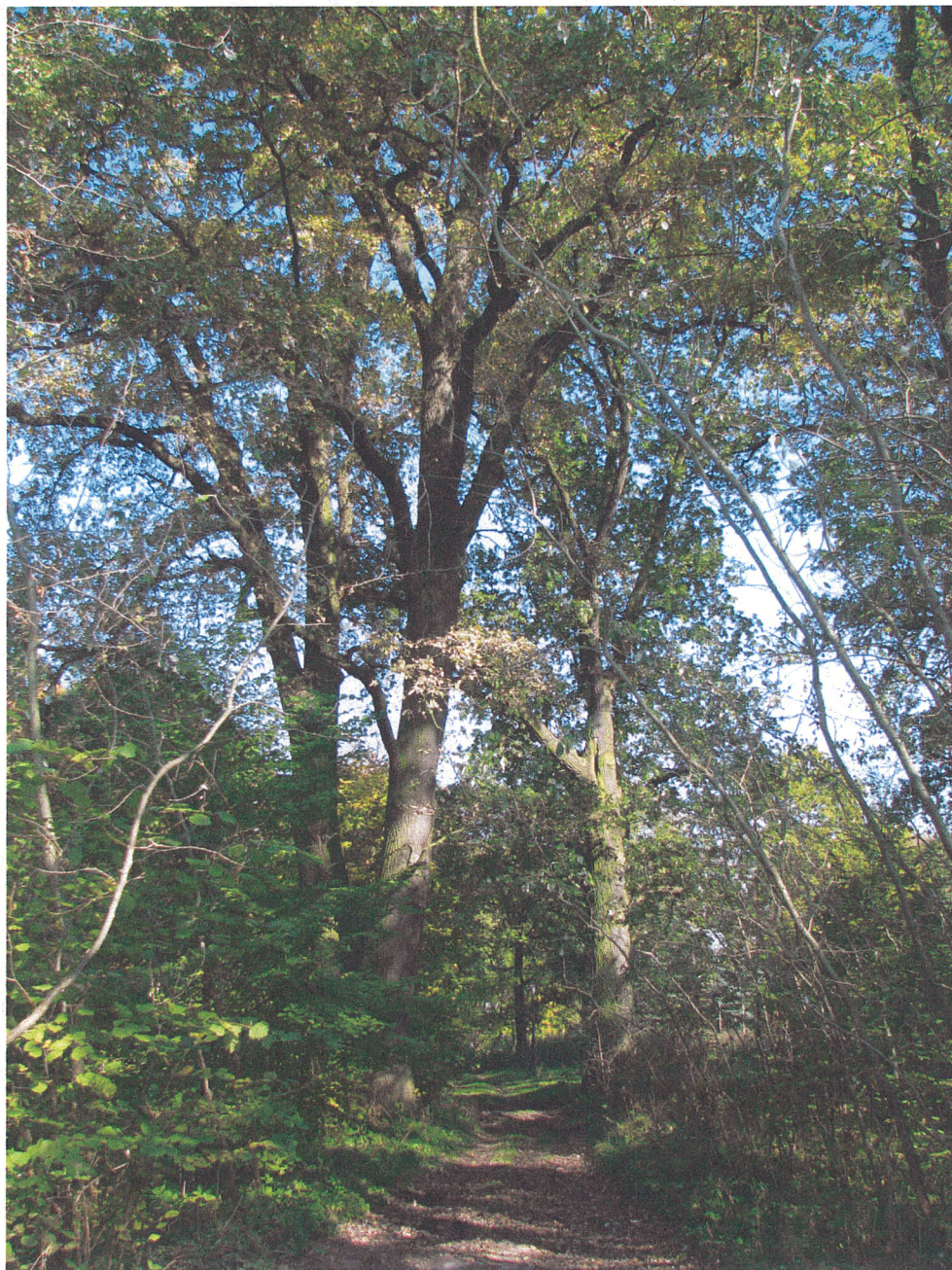
Fot.18. Siemkowice. Aleja parkowa na osi dworu