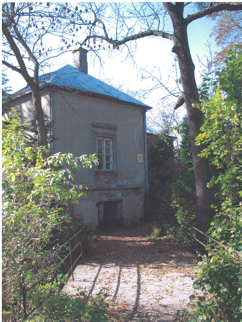
Fot.8. Siemkowice. Mostek prowadzący na wyspę z dworem