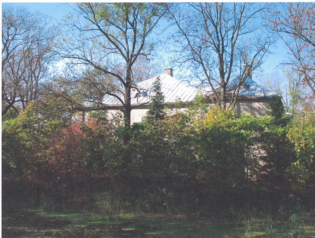
Fot.5. Siemkowice. Widok na dwór obronny od strony południowo-wschodniej