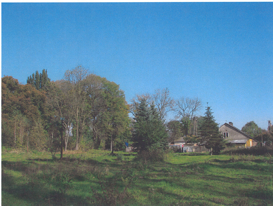
Fot.14. Siemkowice. Widok na wschodnią część parku z współczesnym budynkiem mieszkalnym