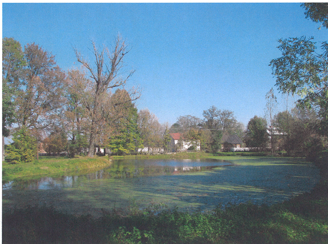
Fot.2. Siemkowice. Widok na większy staw we wschodniej części parku