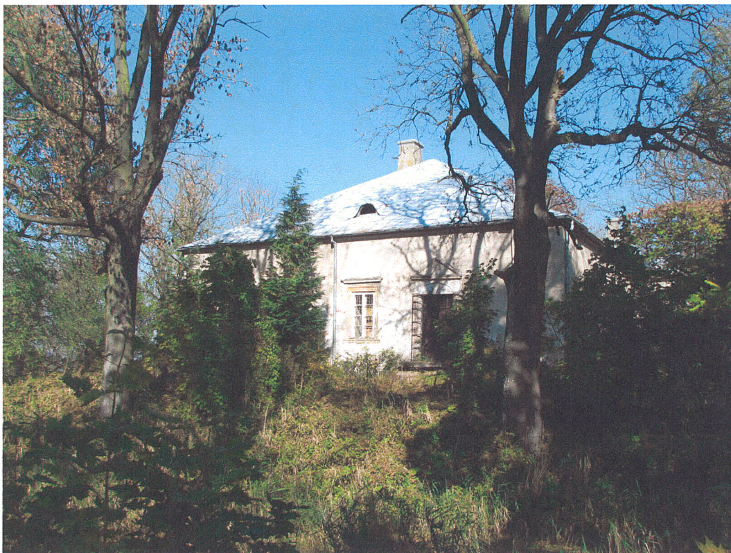
Fot.9. Siemkowice. Widok na dwór od strony południowo-zachodniej