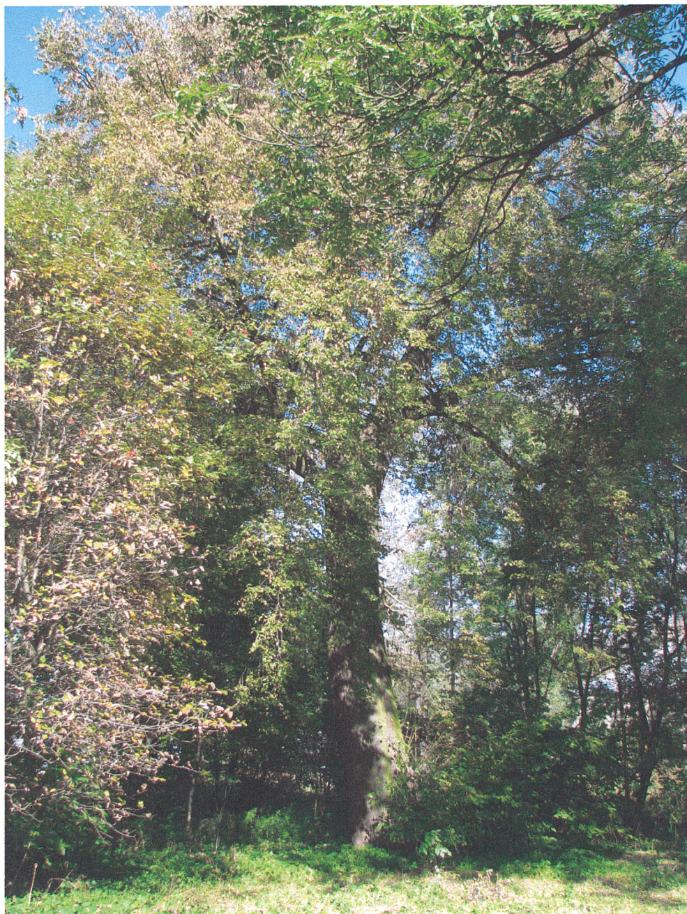
Fot.21. Siemkowice. Pomnikowa lipa drobnolistna (pierśnica 152 cm) w północnej części parku widziana od strony południowej