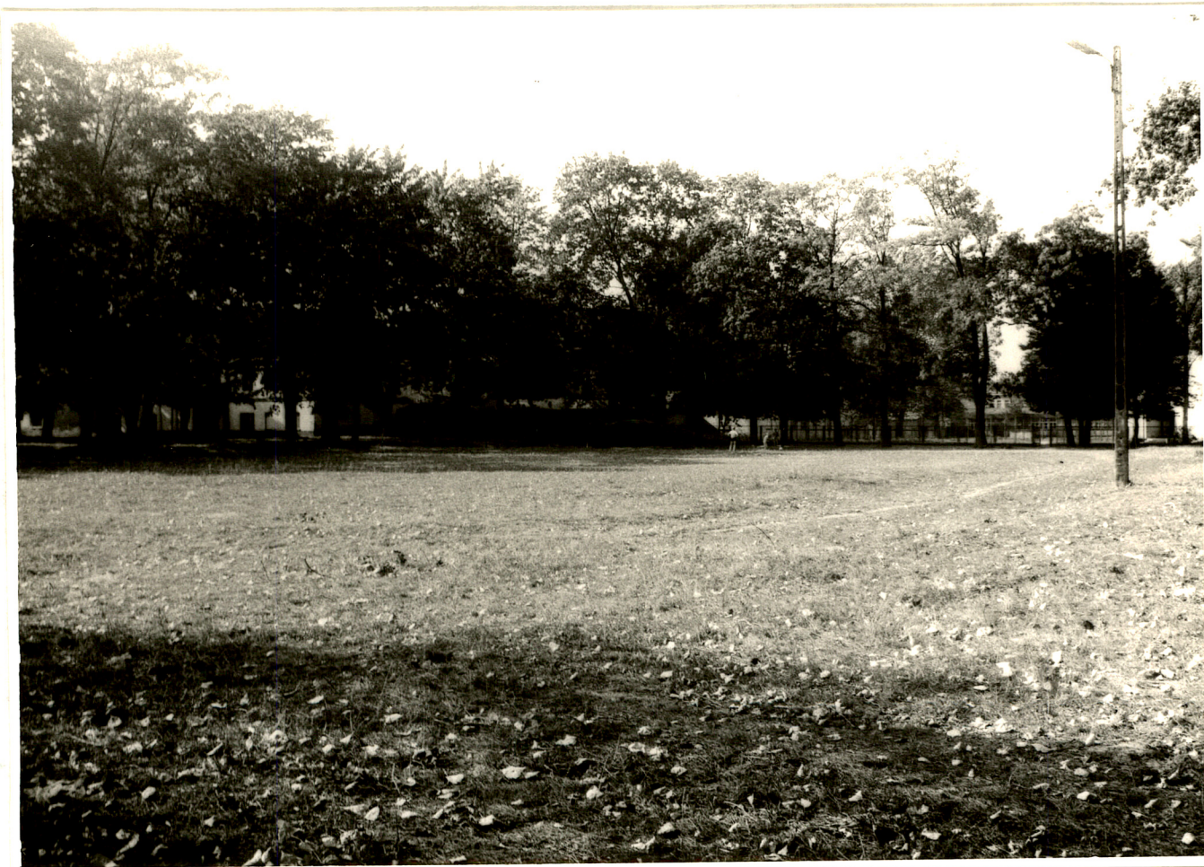
Fot. 7. Boisko oraz fragment wschodniej części parku wraz z pałacem (1992 rok).