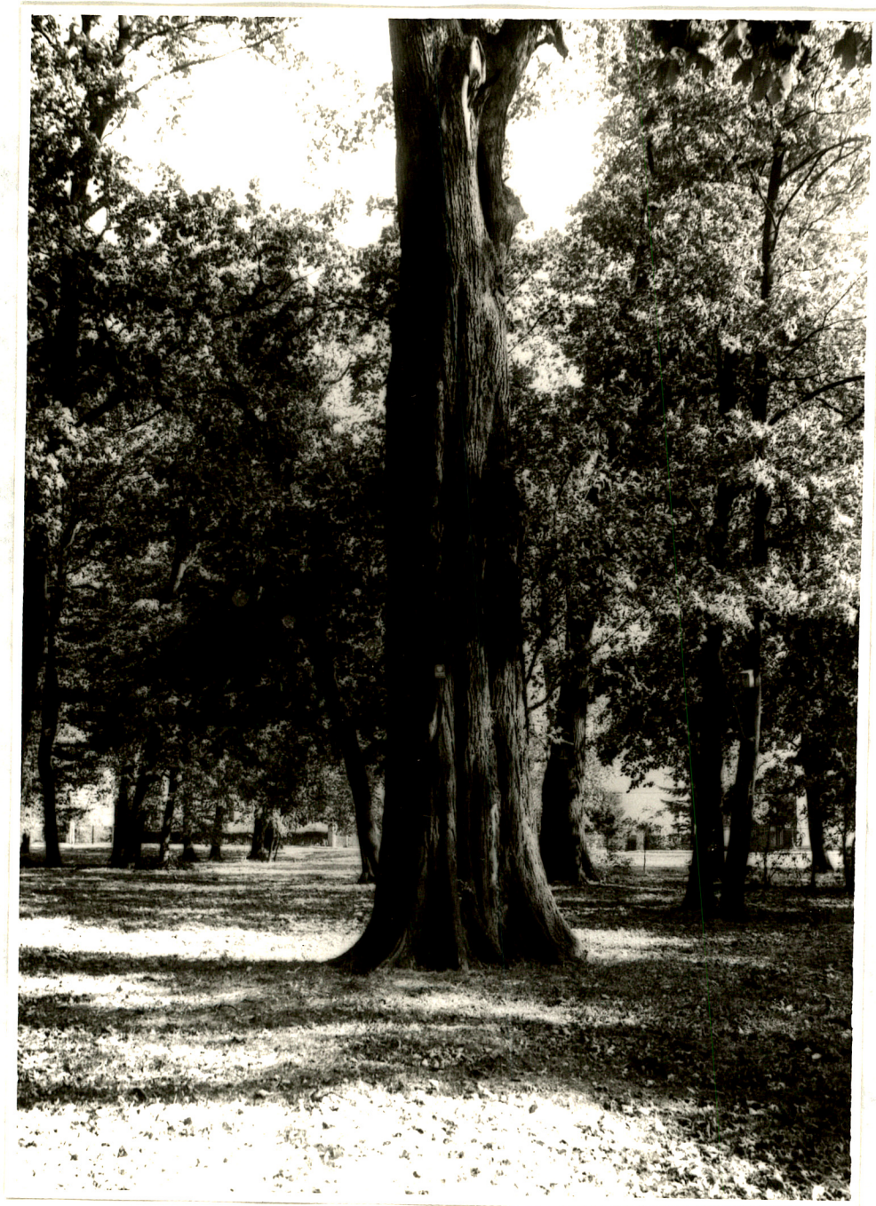
Fot. 5. Pomnikowy wiaz szypulkowy (1992 rok).