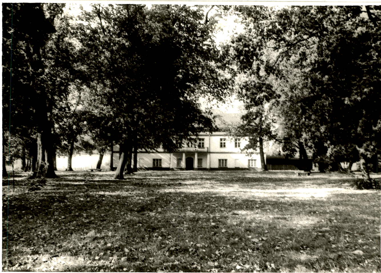
Fot. 3. Pałac od strony parku (1992 rok).