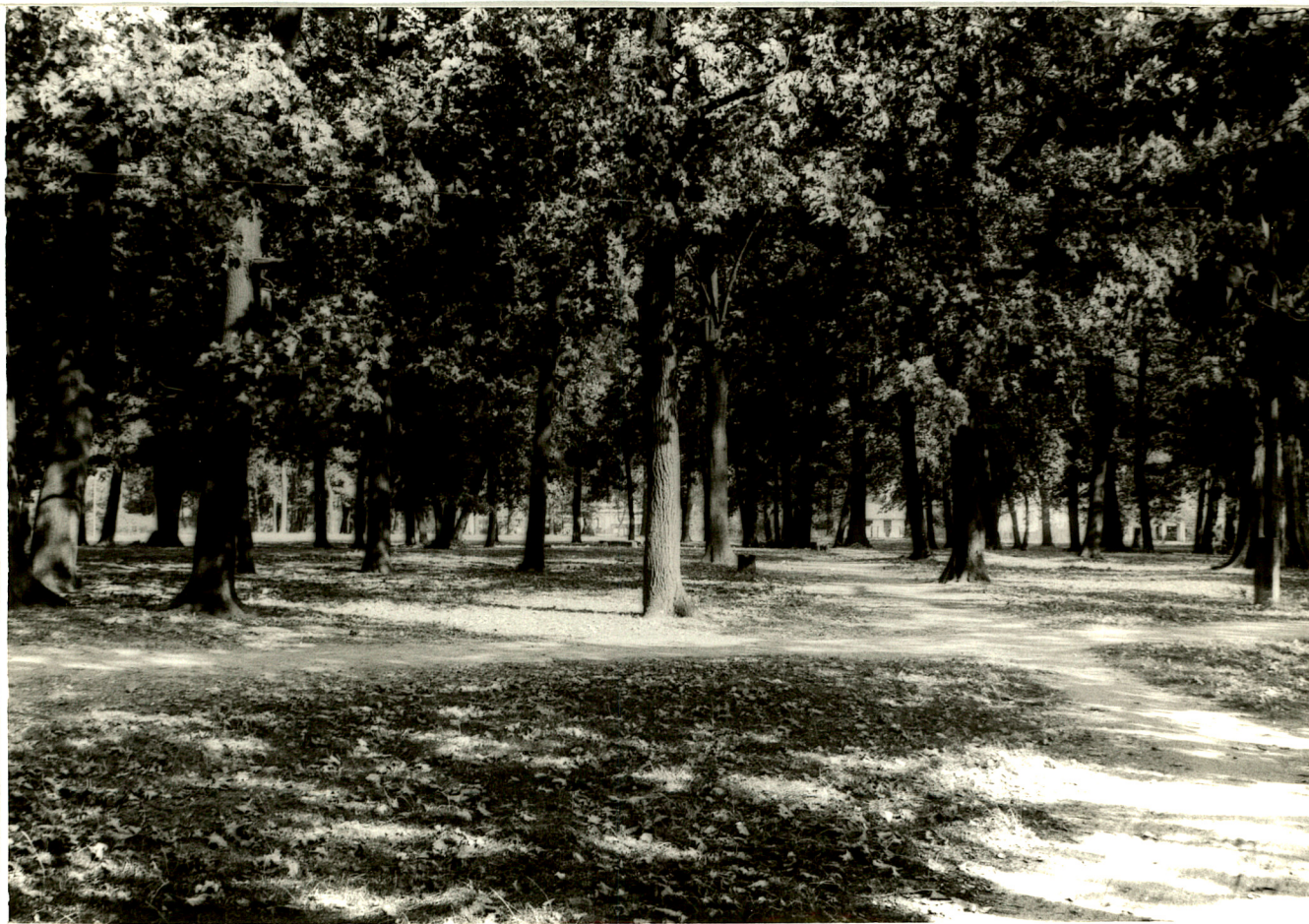
Fot. 4. Wschodnia część parku (1992 rok).