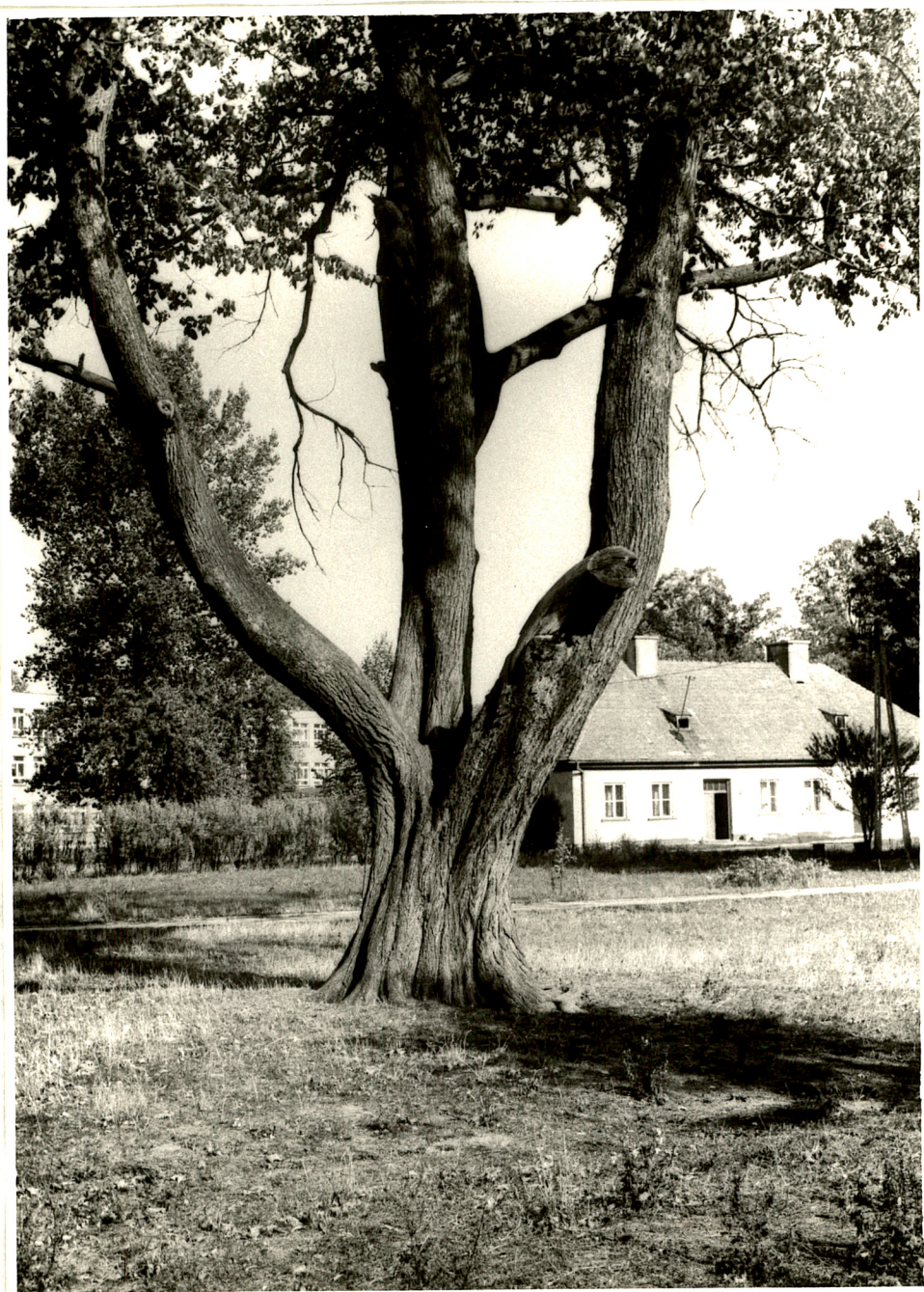
Fot. 2. Pomnikowy wiąz szypułkowy. W tle oficyna oraz zabudowania szkoły (1992 rok).