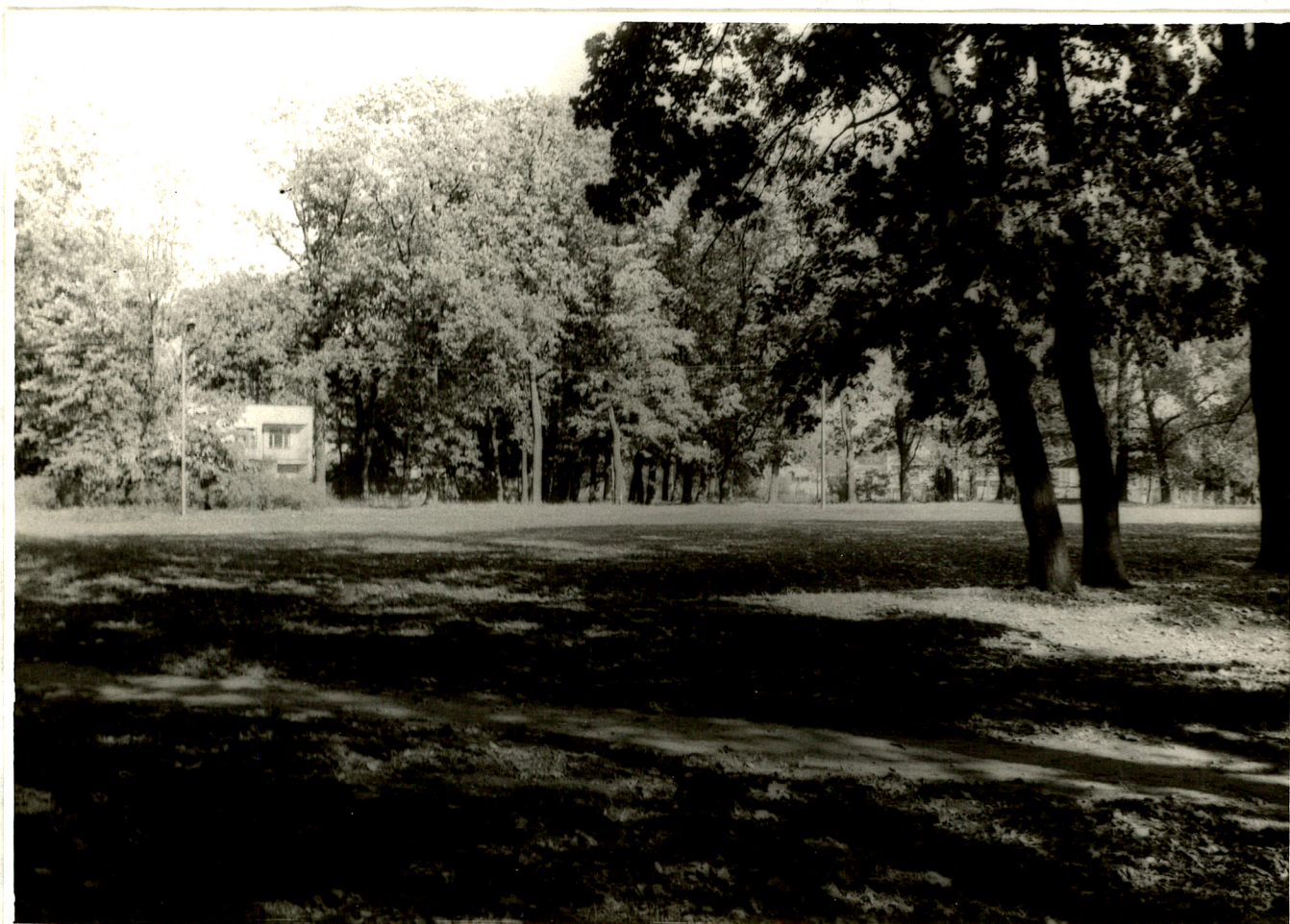
Fot. 6. Widok na boisko sportowe oraz północną część parku (1992 rok).