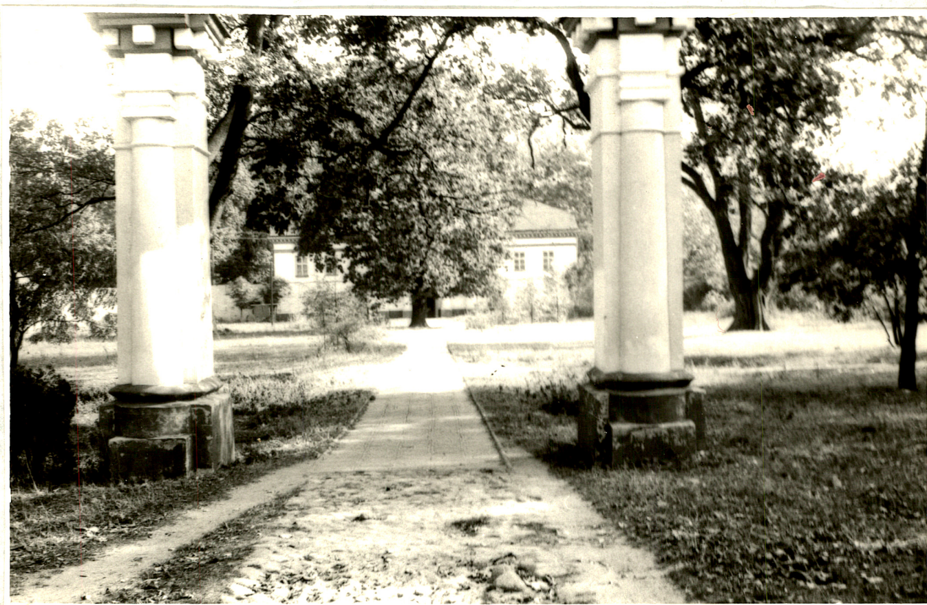
Fot. 1. Pozostałość dawnej bramy wjazdowej. W głębi dziedziniec oraz pałac od strony frontowej (1992 rok).