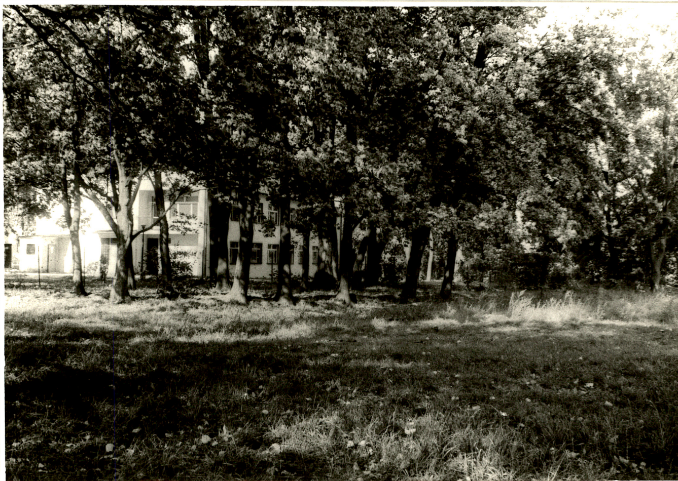
Fot. 8. Północna część parku oraz przychodnia rejonowa (1992 rok).