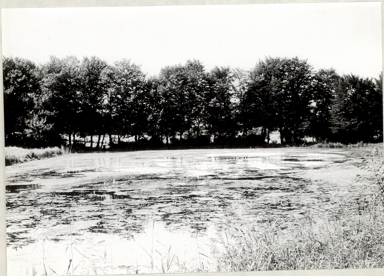
Fot. 3. Konopnica. Staw. 1977.