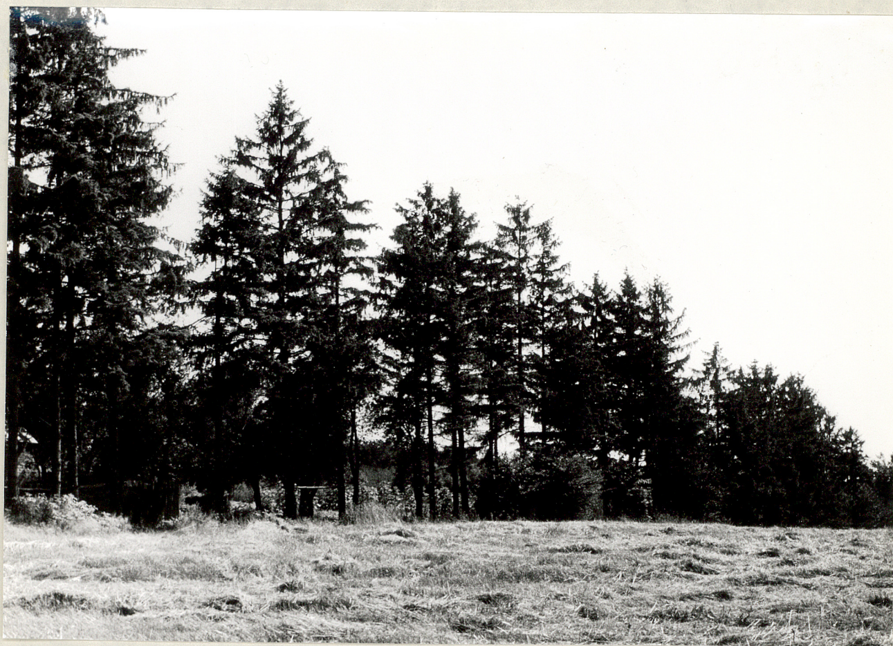
Fot.4. Konopnica. Rząd świerków na skraju parku. 1977.