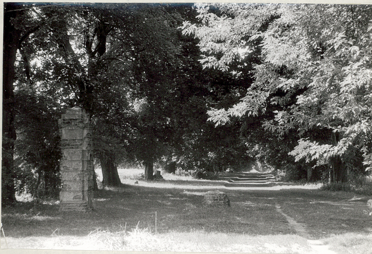
Fot.2. Konopnica. Aleja wjazdowa. 1977.