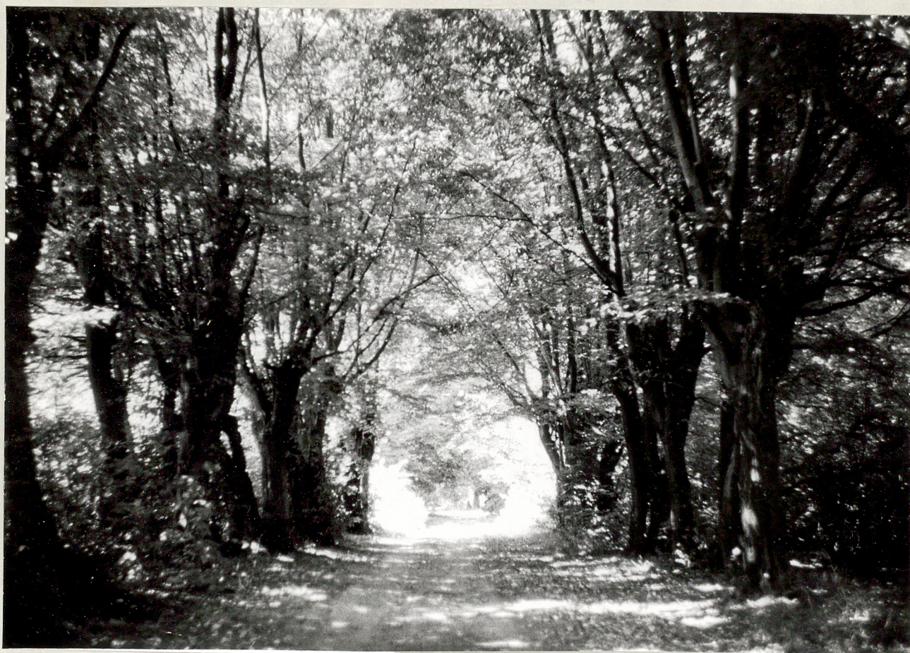
Fot.1. Konopnica. Aleja grabowa. 1977.