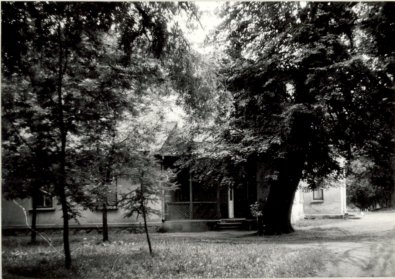
Fot. 1. Celigów. Widok z bramy, 1977.