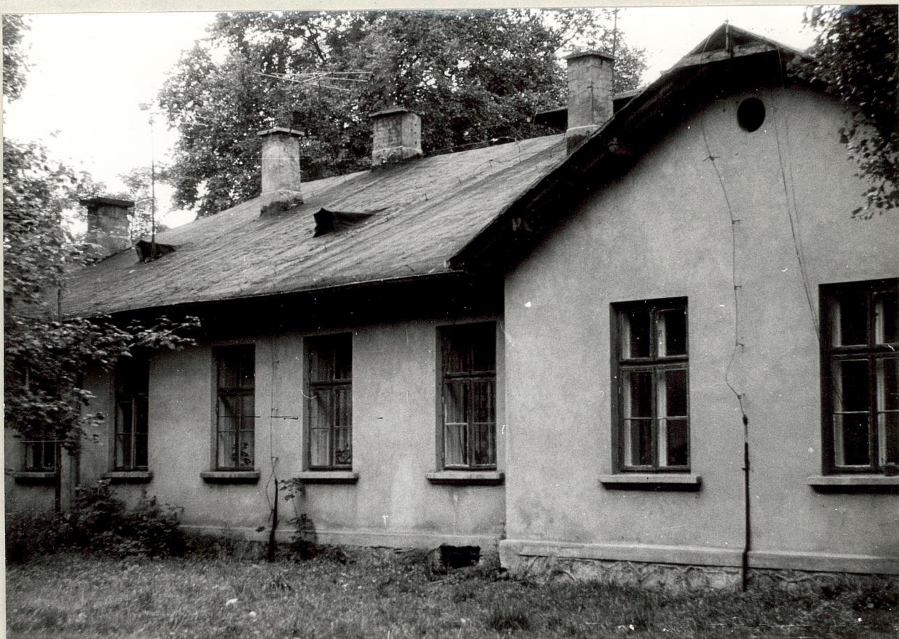
Fot. 2. Celigów. Dworek, 1977.