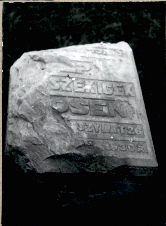
4. Fragment nagrobku (1930r)