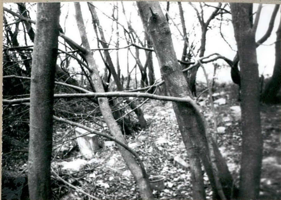
2. Wiat i potężne nagrobki w tym cypis cmentarna