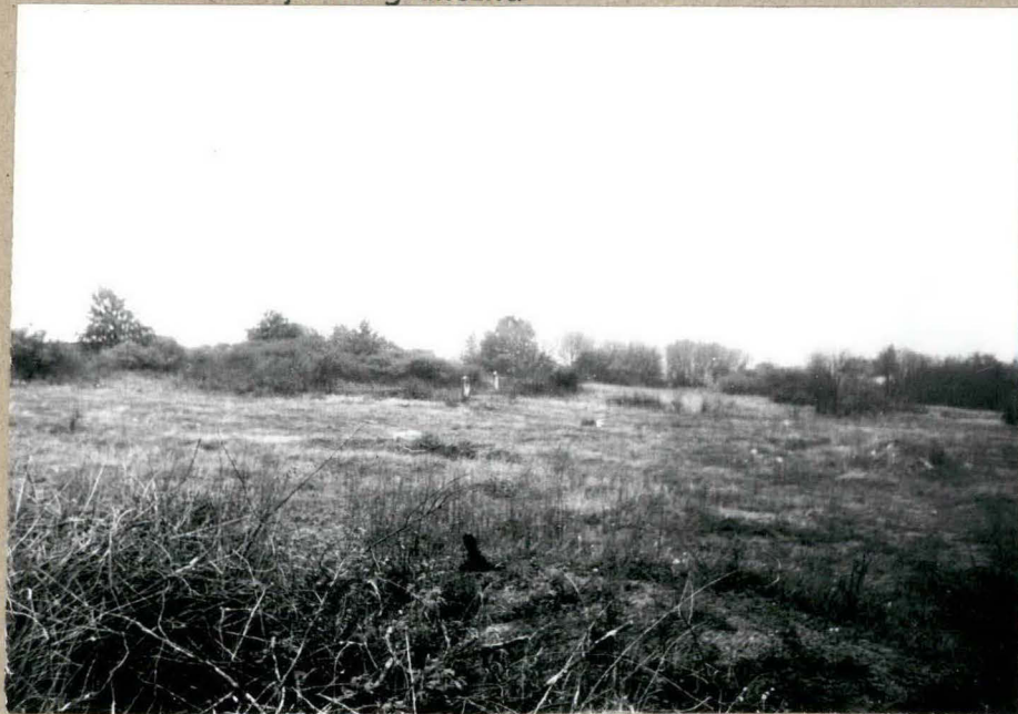
1. Widok od zachodu