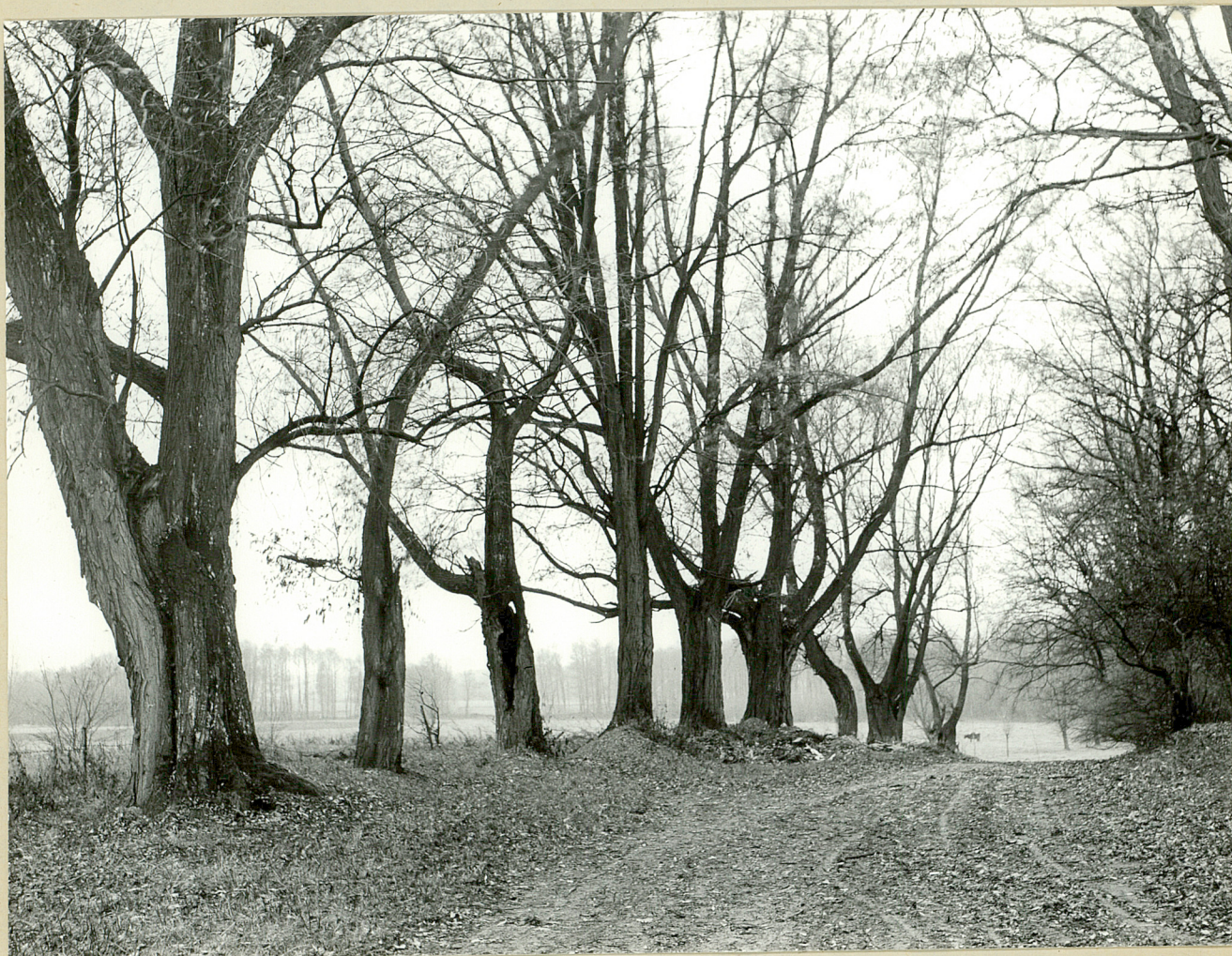
Fot. 3. Zabkocie. Polna droga przy parku. 8.11.79 r.