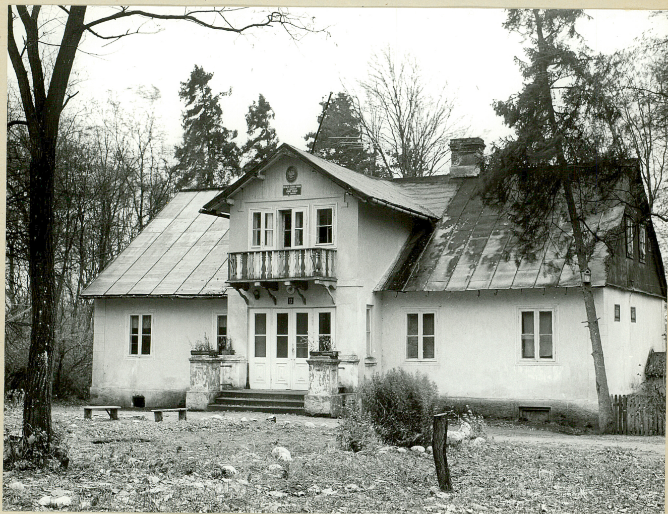
Fot. 1. Zabłocie. Elewacja frontowa dworu. 8.11.79 r.