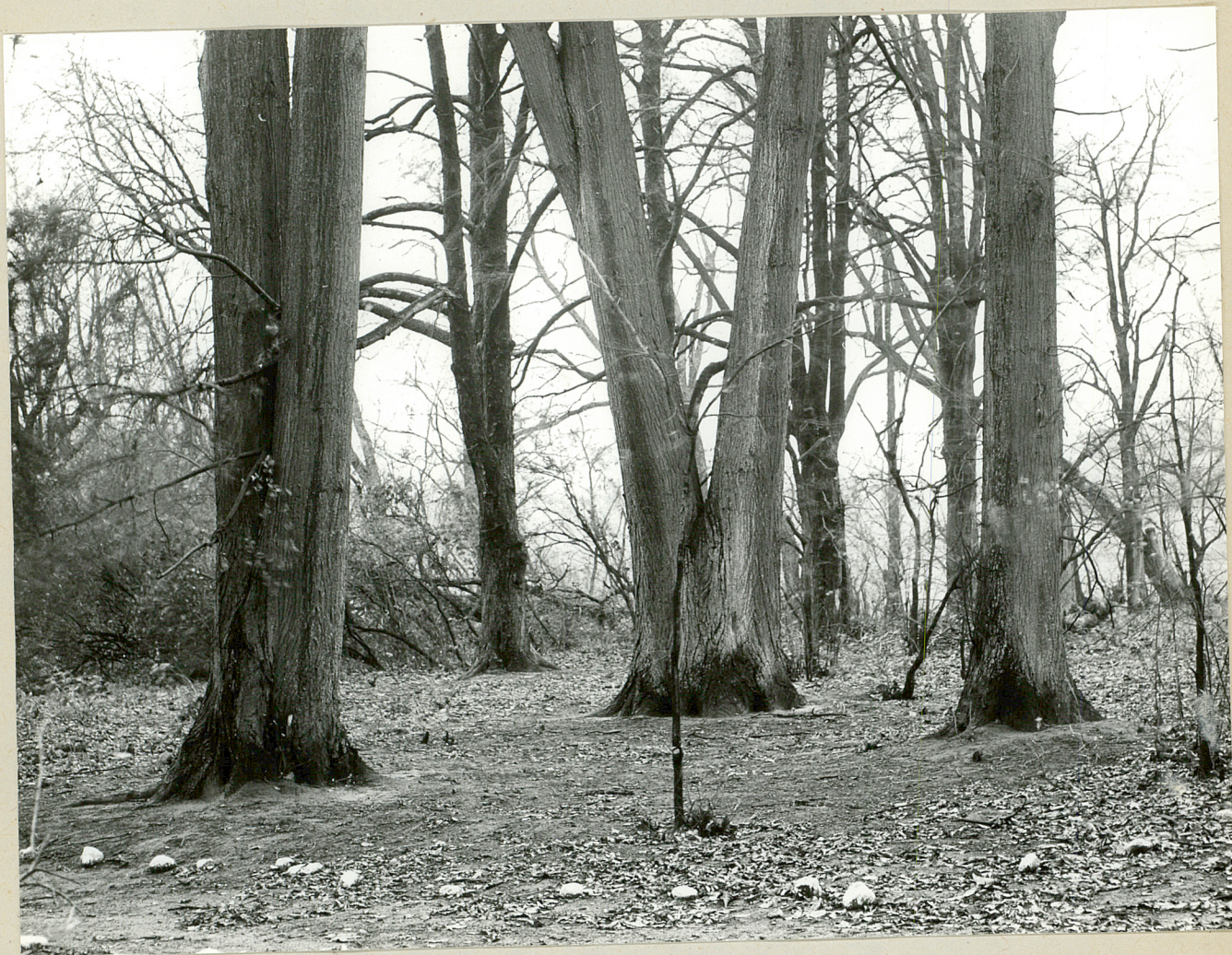
Fot. 2. Zabłocie. Pomnikowe lipy. 8.11.79 r.