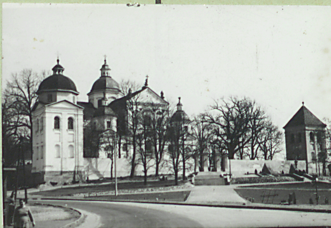
FOT. 1 J.W.