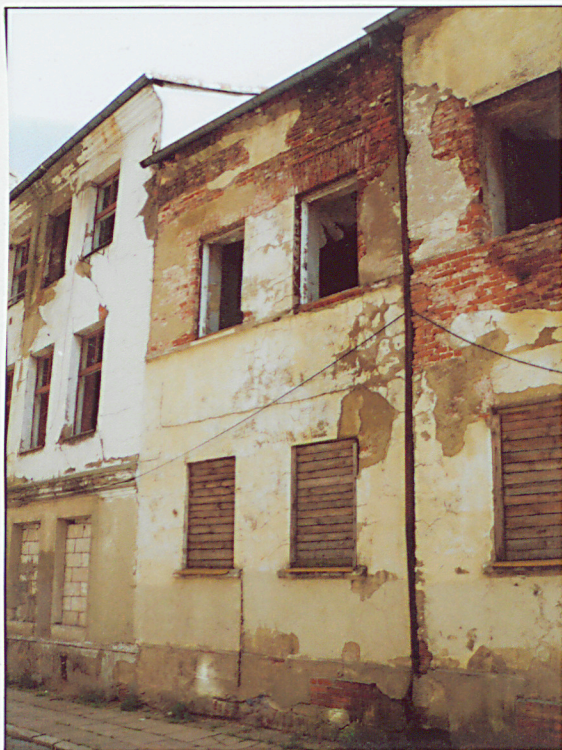
Elewacja frontowa. Część północna.