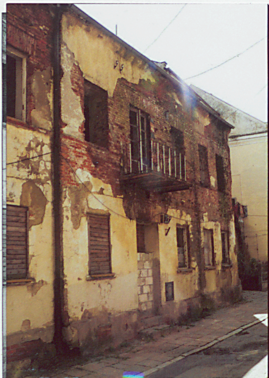
Elewacja zachodnia. Frontowa.