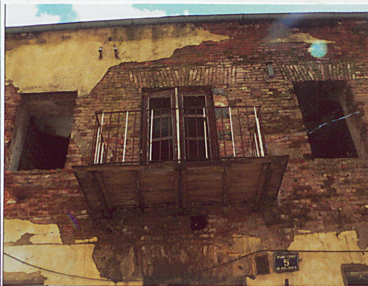
Elewacja frontowa. Część środkowa. Piętro.