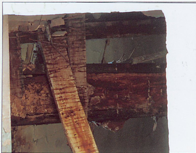
Wnętrze. Fragment stropu.