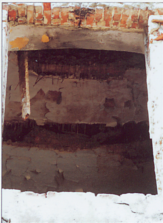
Wnętrze. Fragment stropu.