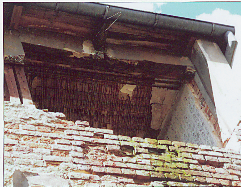
Wnętrze. Fragment stropu.