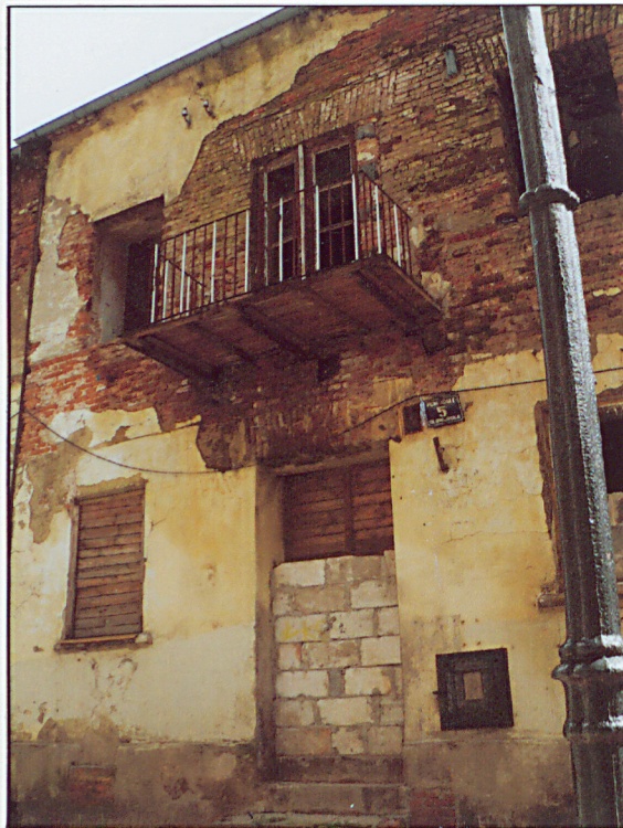
Elewacja frontowa. Część środkowa.