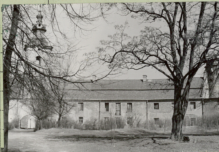
FOT. 2. J.W.