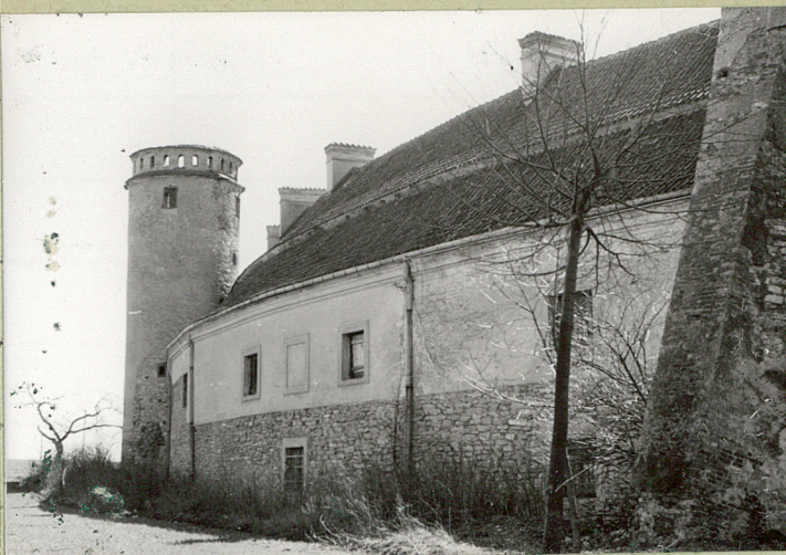
FOT. 1. J.W.