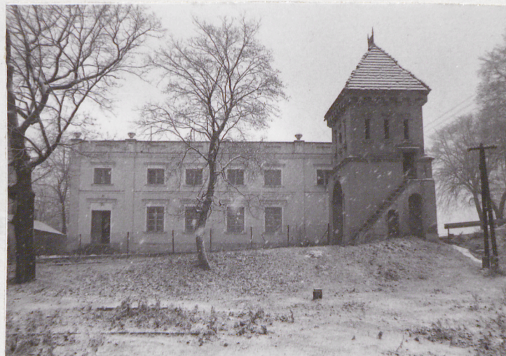
Widok od str. pd.