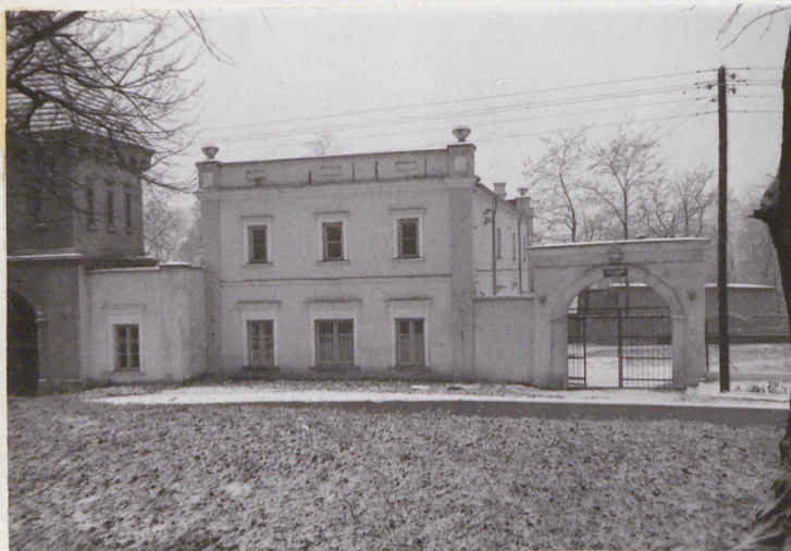
Widok od str. wsch.

11 Zdjęcia rzut, przekrój, sytuacja, orientacja