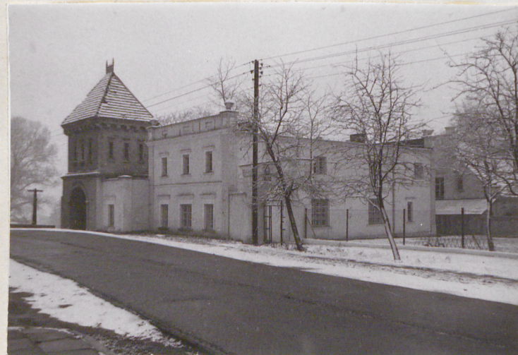
Widok od str. pn.-wsch.