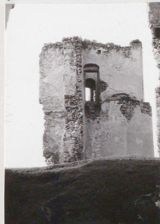
Widok baszty od wschodu