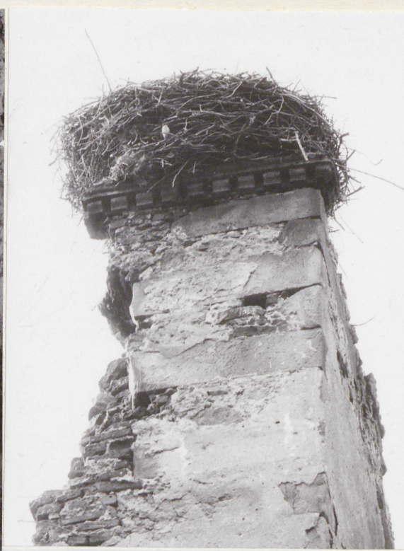
Fragment gzymsu w ryzalicie wschodnim