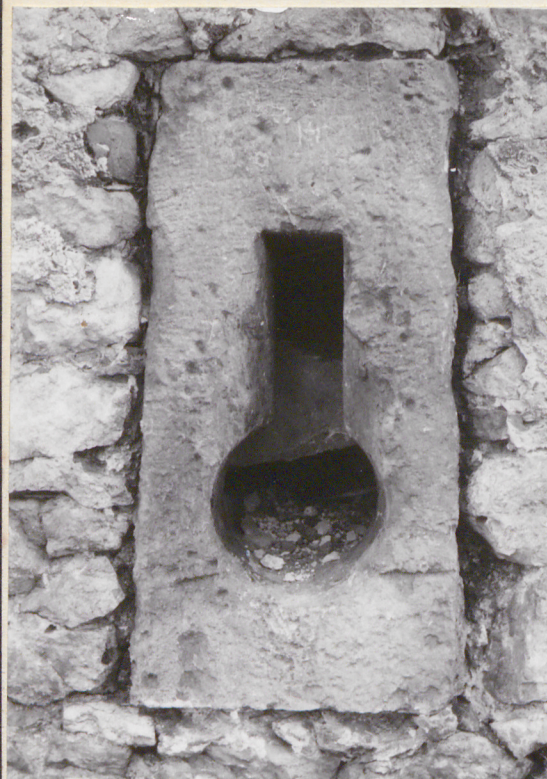
Strzelnica w baszcie