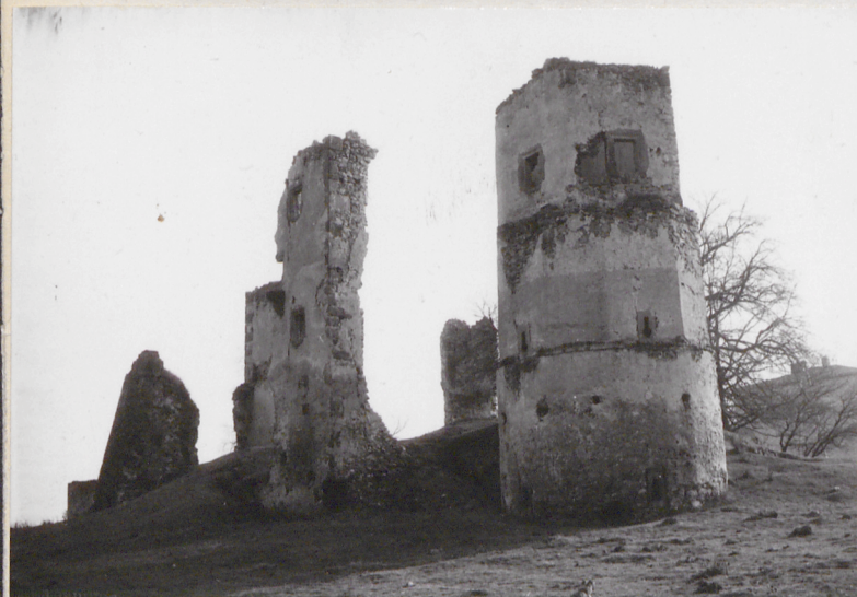
Widok od półn.-zach.