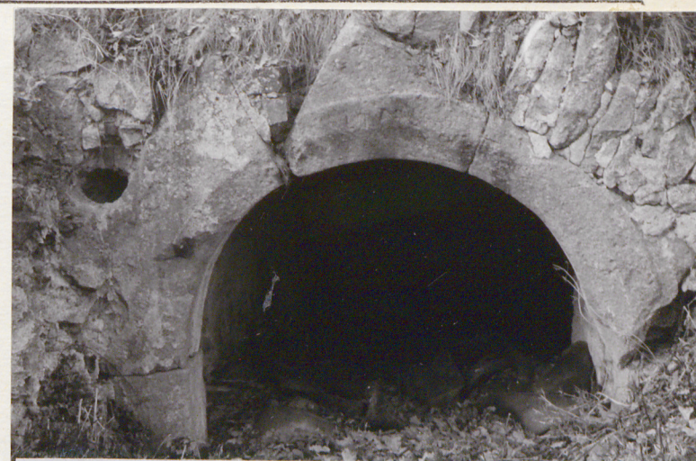
Portal wejściowy w piwnicy