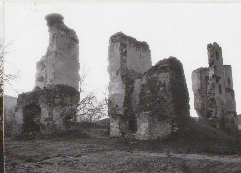
Widok od strony pn.-wsch.