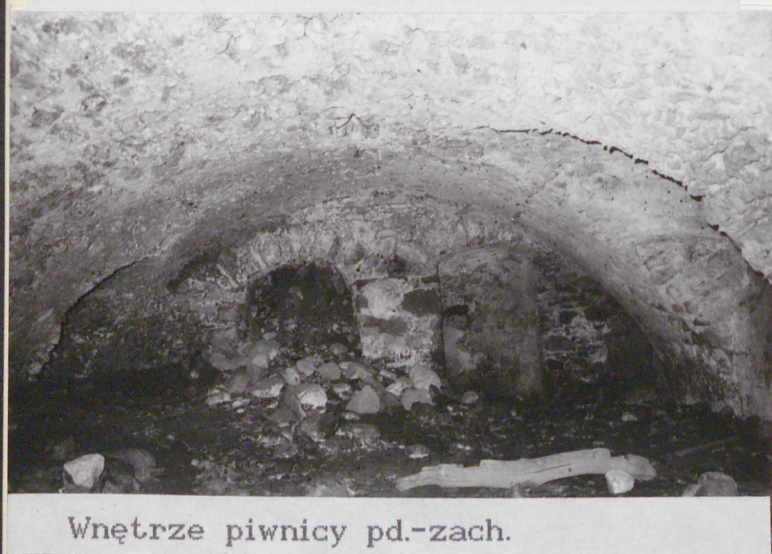
Wnętrze piwnicy pd.-zach.