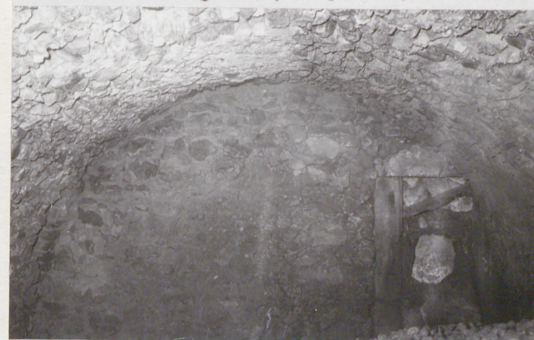
Wnętrze piwnicy półn.-wsch.