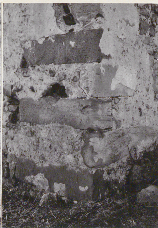
Narożnik w ryzalicie wsch.