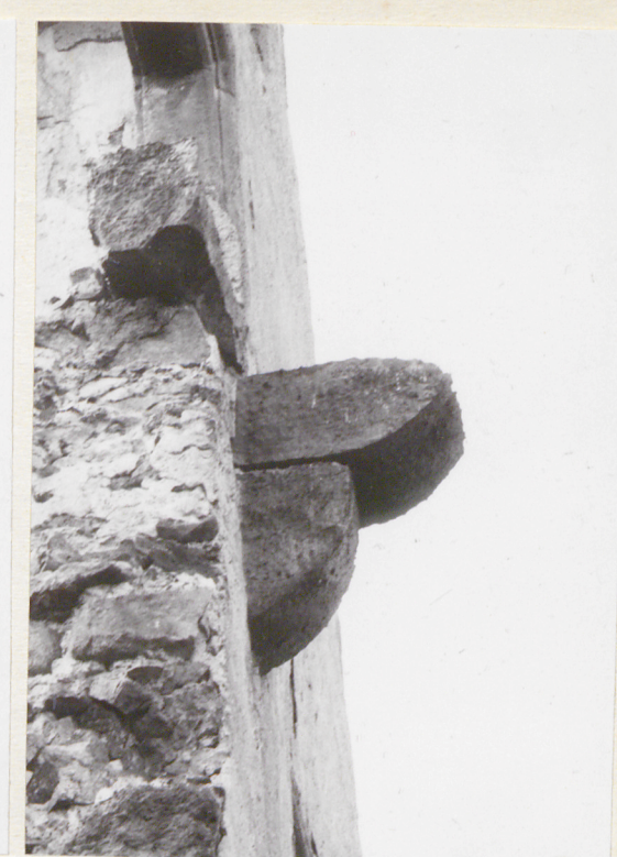
Kroksztyn w ryzalicie półn.