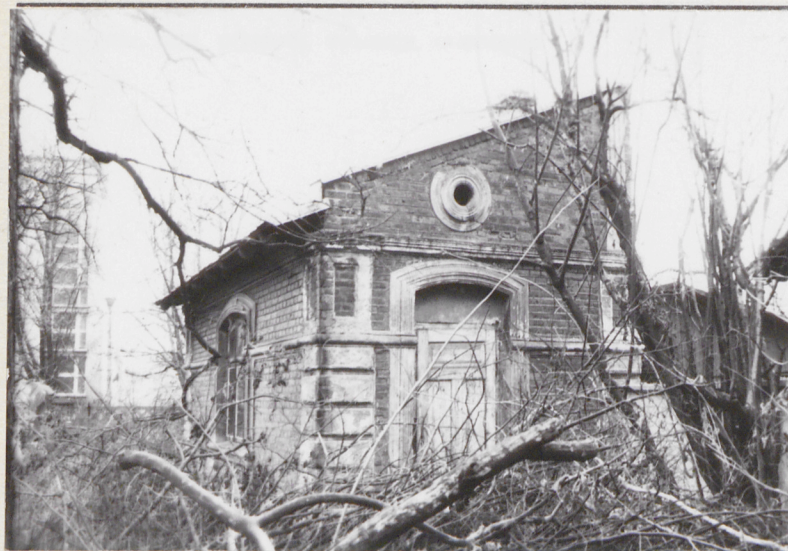
1. Widok ogólny