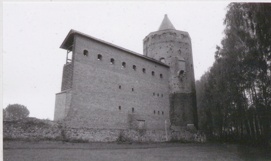
4. Elewacja pd - zach