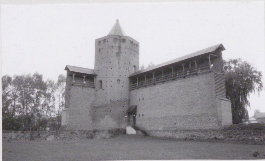
3. Elewacja północna