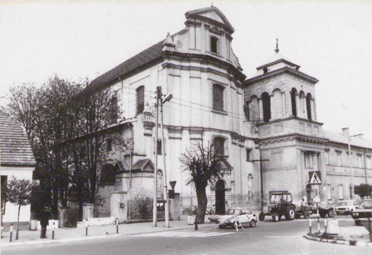
1. Elewacja frontowa (uschi)

11. Zdjęcia, rzut, przekrój, sytuacja, orientacja