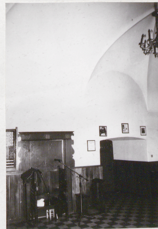
12. Zakryta, z prawej okna do prezbiterium, z lewej do piwnic