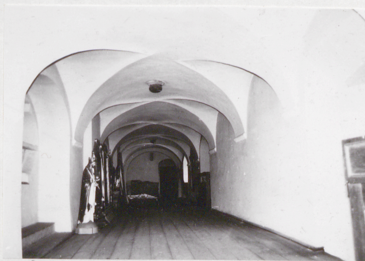
11. Empora nad kaplicami bocznymi