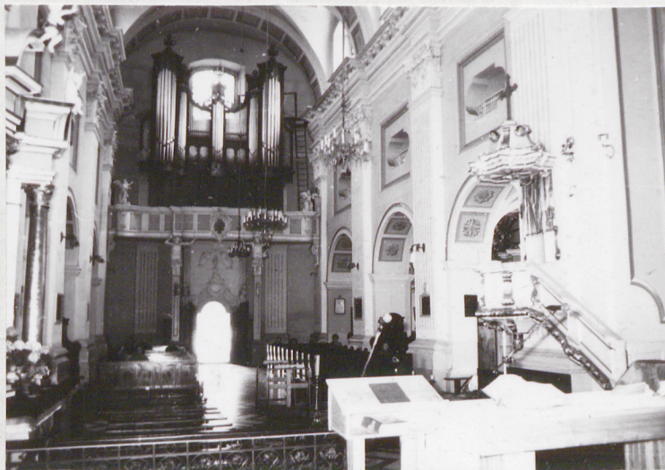
8. Wnętrze, kłęczka