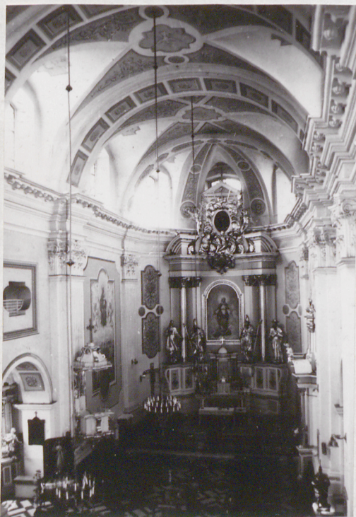
7. Wnętrze, prezbiterium