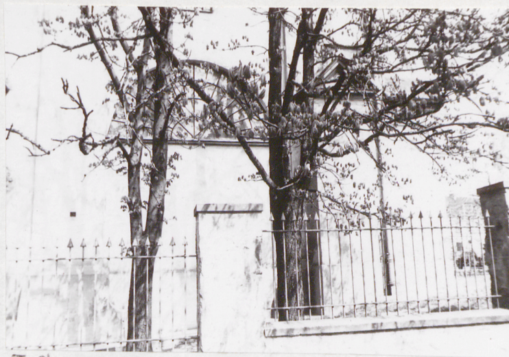
5. Okno i elewacji pól.