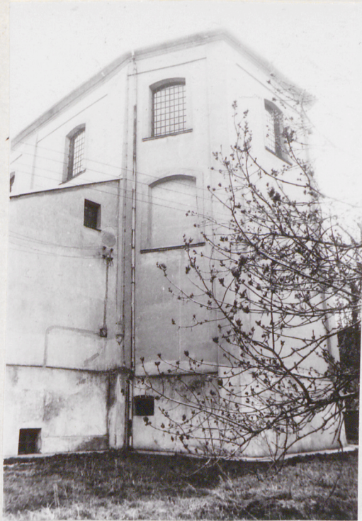
4. Główna ściana i uskok