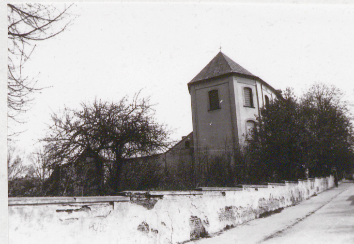
3. Elewacja zau. prebiterium