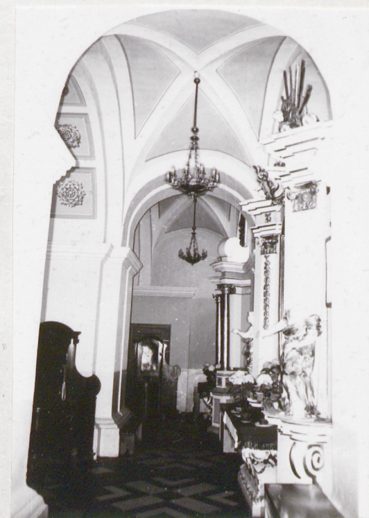
9. Kaplica boczna