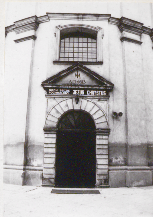
6. Portal i elew. frontowej