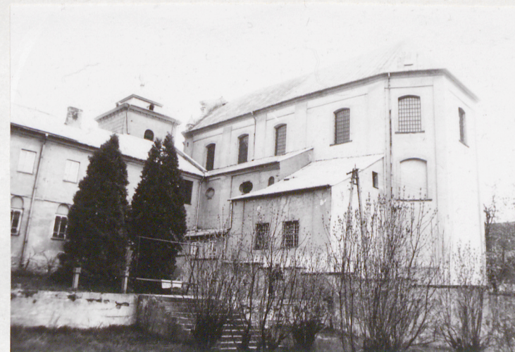
2. Elewacja p.m. kościoła