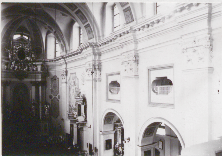
10. Wnętrze, od strony wejścia i emporali

Instalacje: elektryczna, odgromowa, wodno-kanalizacyjna.