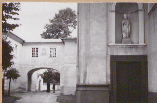
Zjednoczenie - zam. 1858, 16. 11. 87 - 12000 - kart.