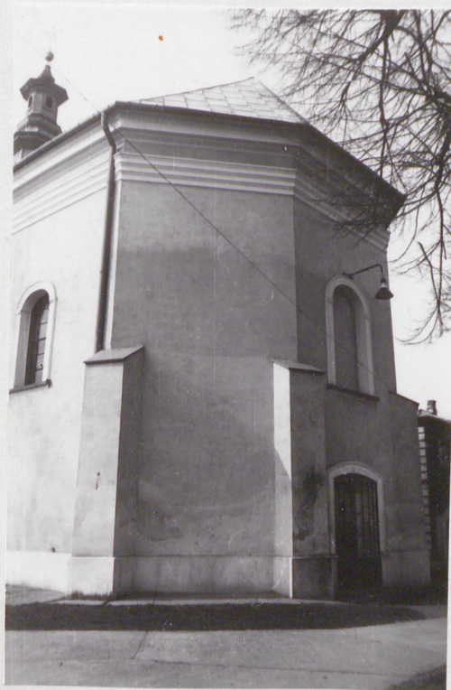
6. Elew. wsch.