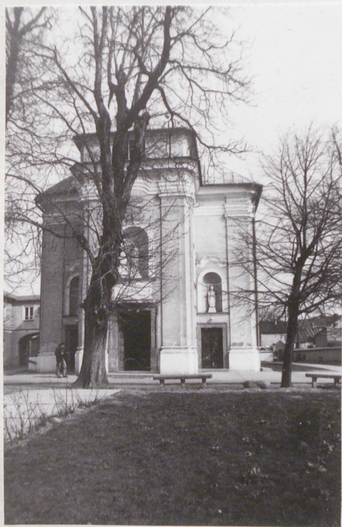
5. Elew. zach.