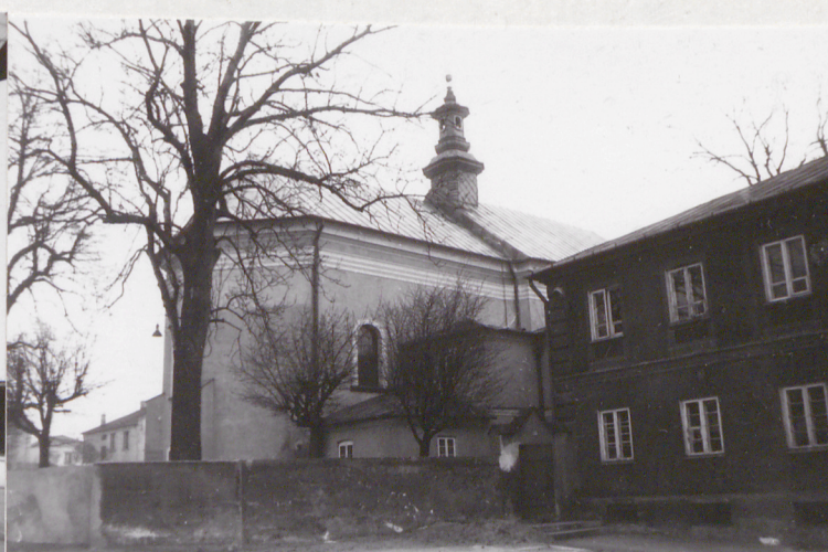
3. Elew. ptn.