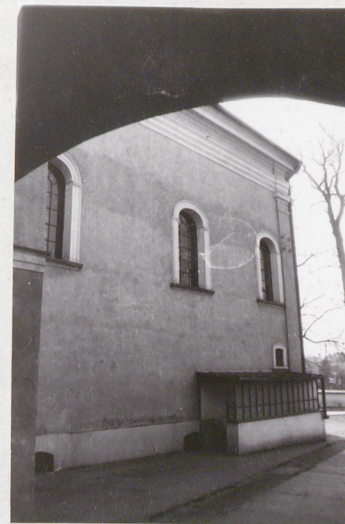
8. Elew. ptn. mury, zejście do krypt.