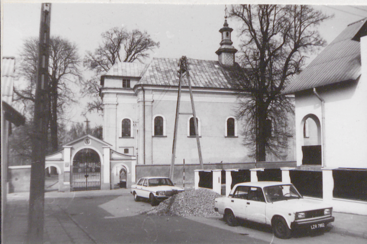
2. Elew. ptd.