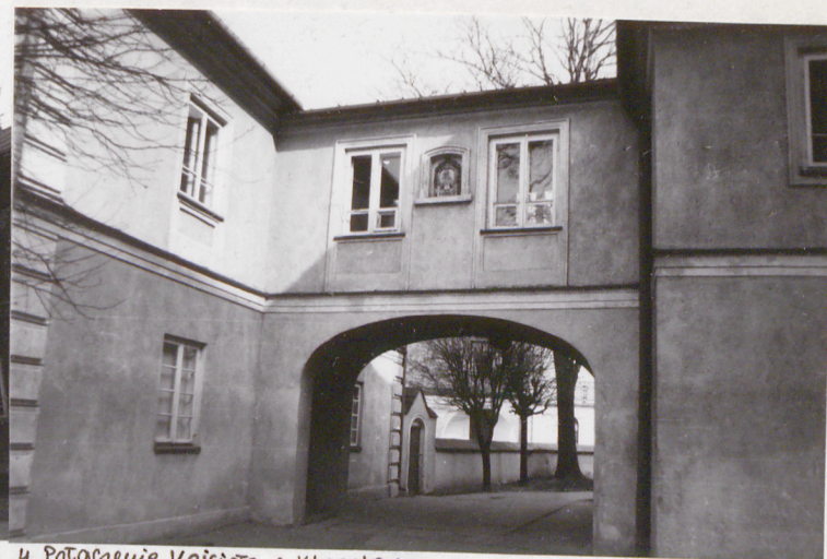
4. Fotogenia kościoła z klasztorem