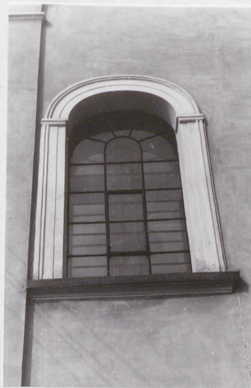
7. Okno u mianie