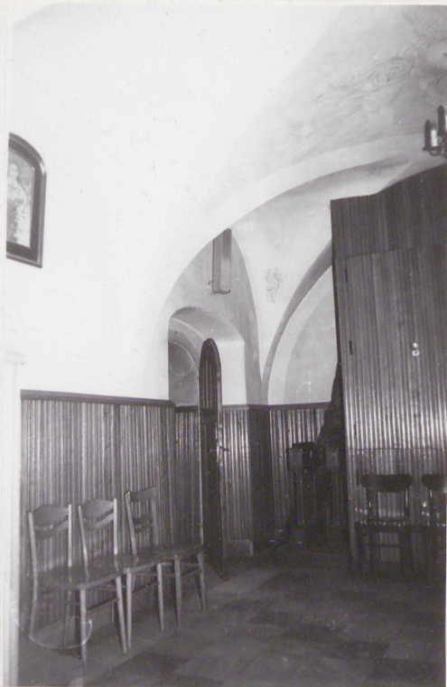
10. Pred rioneu zalutis, obrudavane kejtice na ambone.