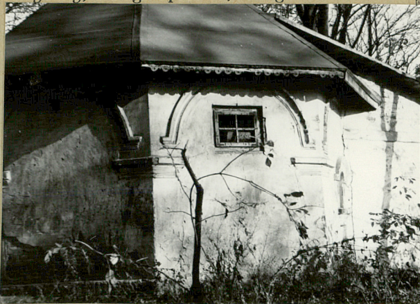
ematyczny, uwagi opisowe, fotografia