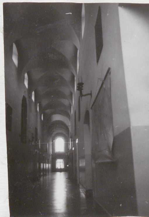
Korytarz I piętra