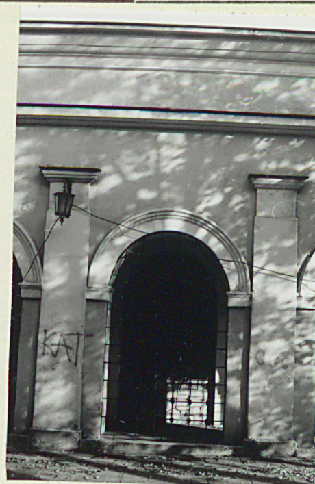
ARKADA W ELEWACJI ZACHODNIEJ