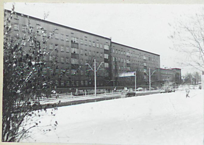
autor zdjęć E. Szelańska data wykonania 01.90r miejsce przechowywania negatywów WKZ-Łódź