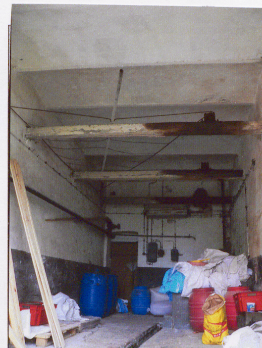
Pomieszczenie od południowego-zachodu.