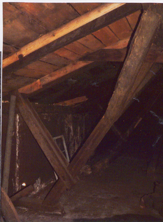
Wieżba dachowa nad ryzalitem.