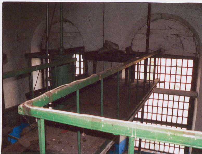
Wnętrze. Antresola nad pomieszczeniem głównym.