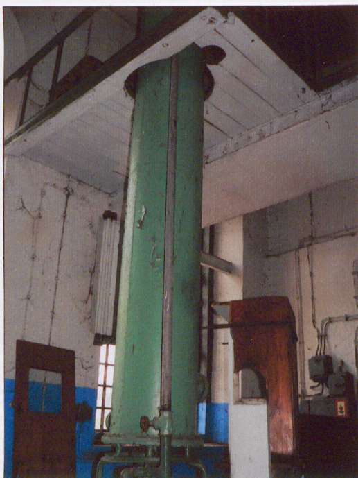
Wnętrze. Pomieszczenie główne. Kolumna rektyfikacyjna.