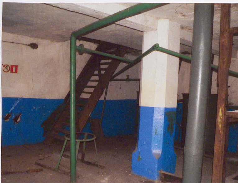
Antresola. W głębi schody na strych nad ryzalitem.