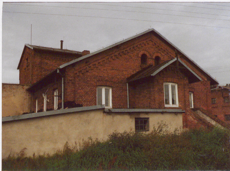
Elewacja wschodnia. Widok od południowego-wschodu.