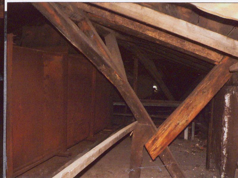
Wieżba dachowa nad ryzalitem.