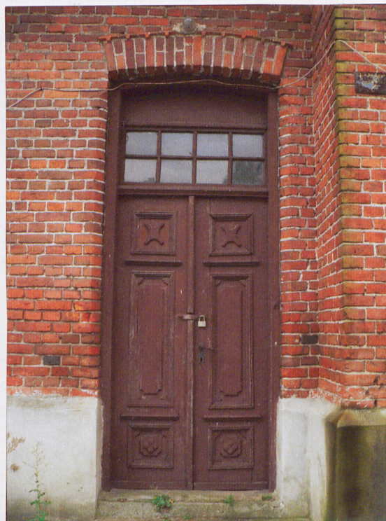
Elewacja frontowa. Drzwi wejściowe.