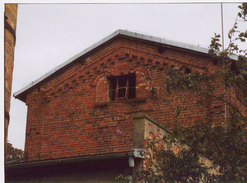
Elewacja południowa. Ściana szczytowa ryzalitu.