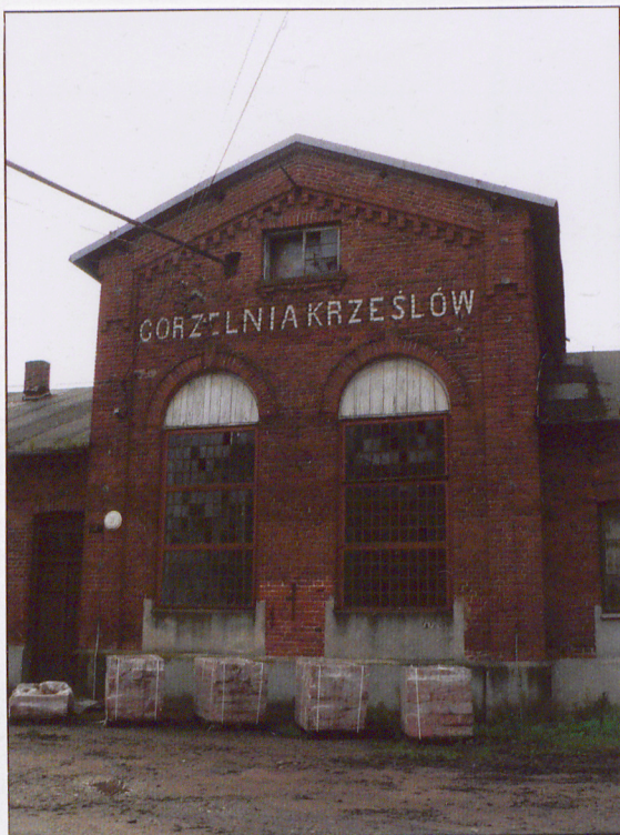
Elewacja frontowa. Ryzalit.