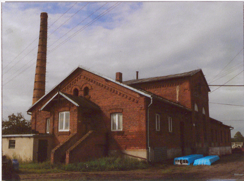
Elewacja wschodnia. Widok od północnego-wschodu.