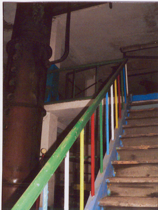
Weście na antresole.