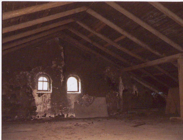
Wieżba dachowa nad częścią wschodnią.