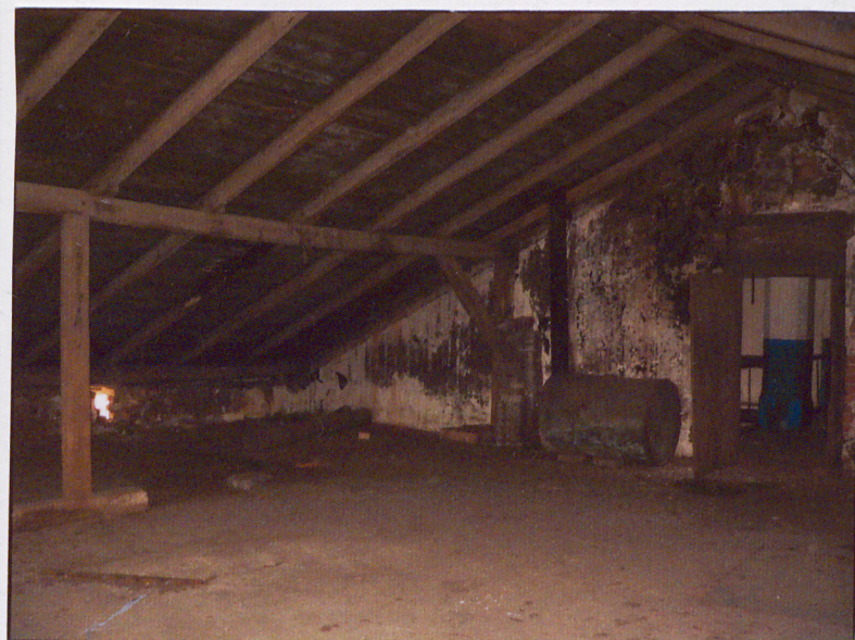
Wieżba dachowa nad częścią zachodnią.