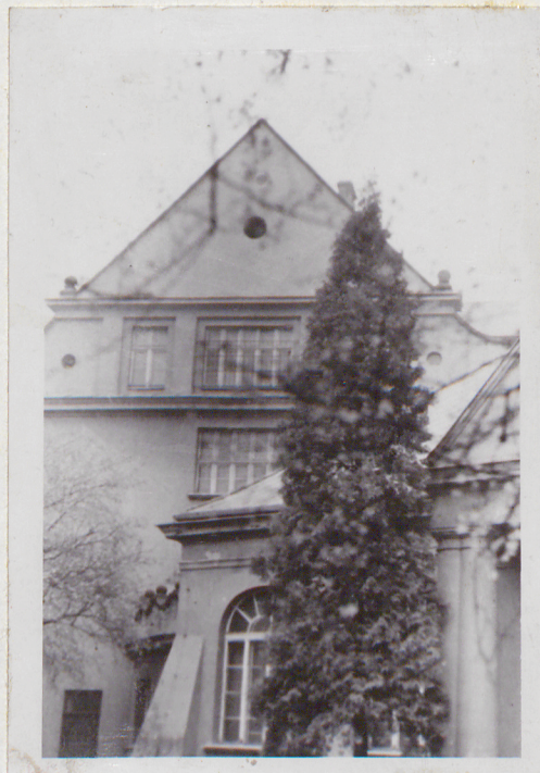
2. Elewacja południowa

Wkładkę założył: Ewa Mosiniak, X 1983 (imię, nazwisko, data)