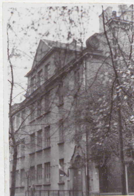
2. Elewacja wschodnia