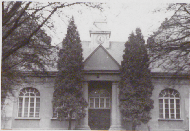
2. Elewacja północna

Wkładkę założył: Ewa Mosiniak, X 1983 (imię, nazwisko, data)