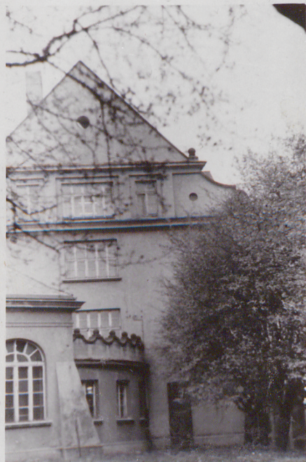
1. Elewacja północna