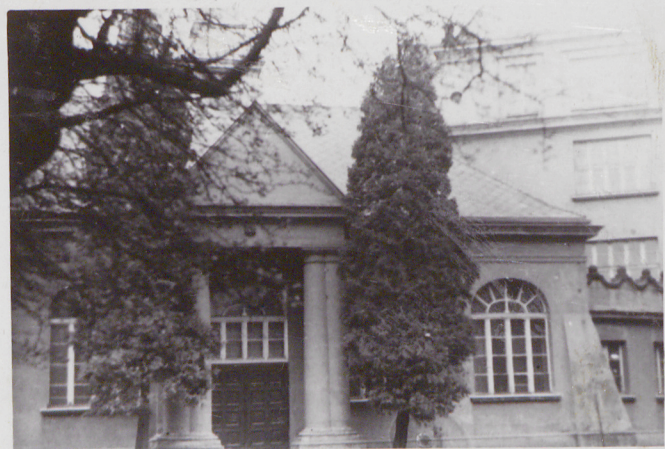
1. Elewacja północna