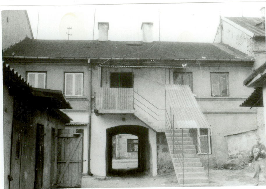
widok od strony podwórza