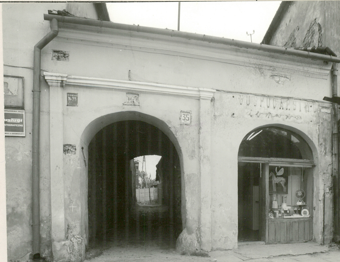
ŁOWICZ RYNEK KILIŃSKIEGO 35