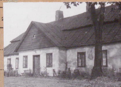
X. 1959r.