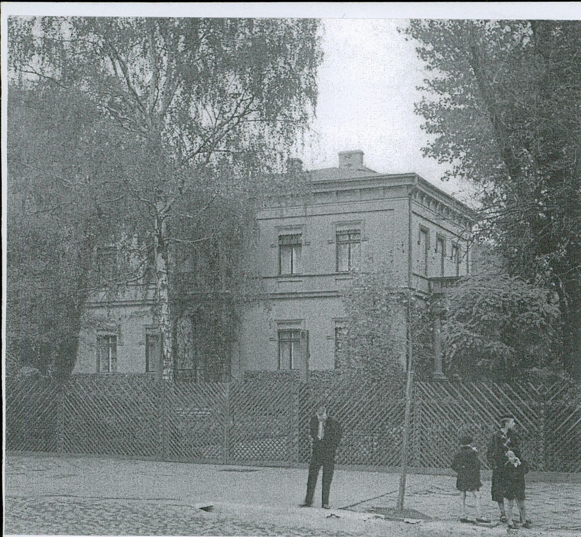
Widok willi R. Geyera, l.30. XX w.