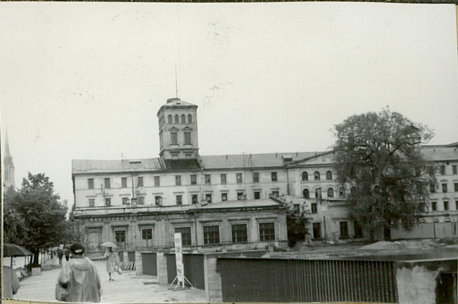
fol. Łonyn, 1964