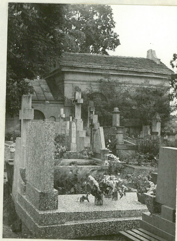
Widok od strony wschodniej