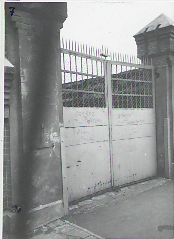
7. detal arch. ogrodzenia