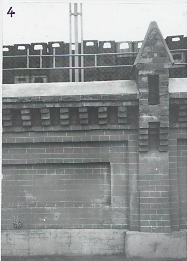
4. detal arch. ogrodzenia