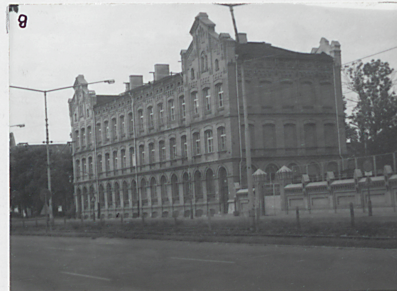
9. Widok ogólny na ogrodzenie