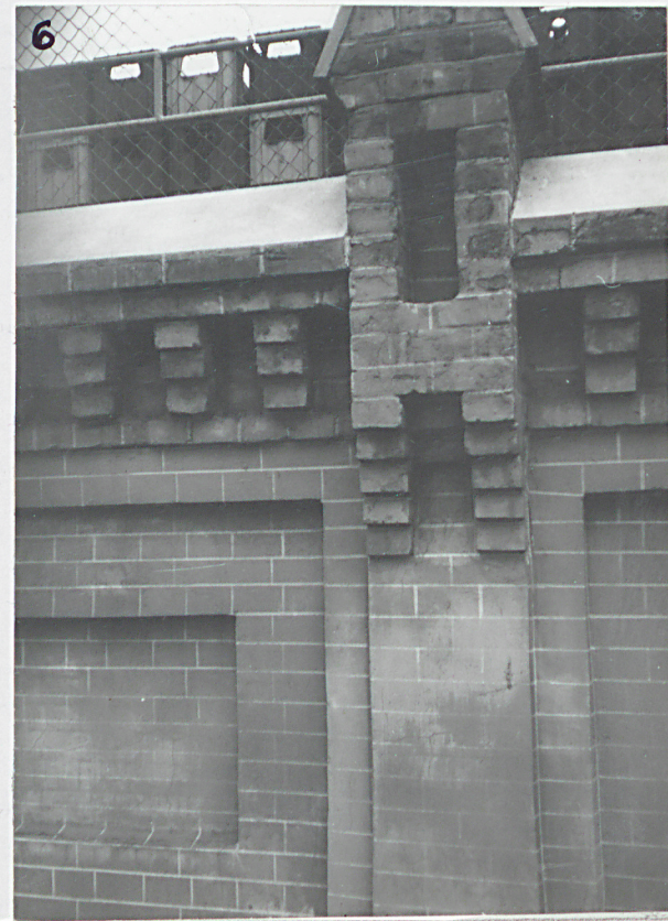
6. detal arch. ogrodzenia