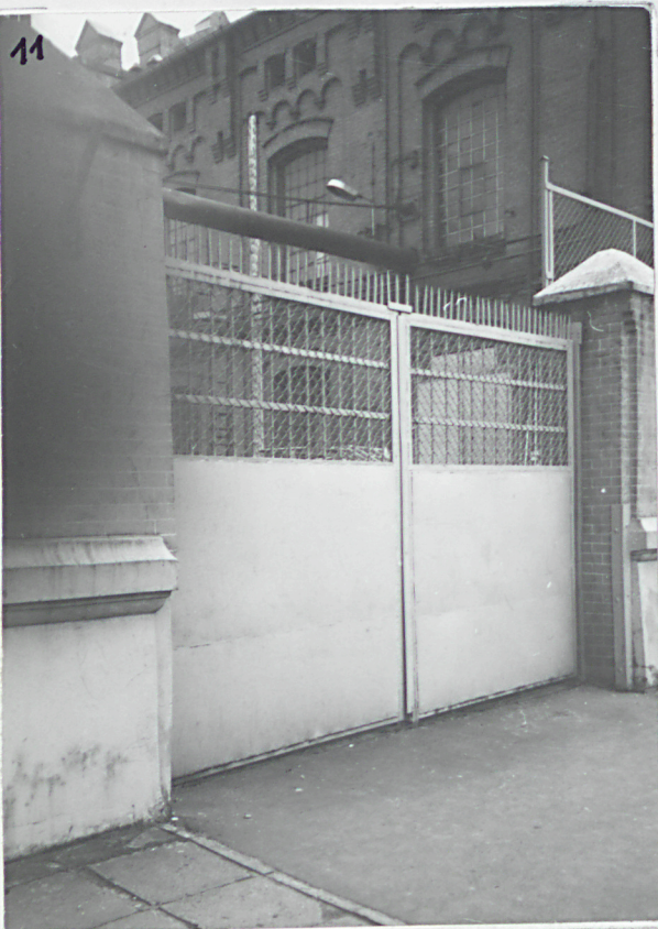
11. Brama północna