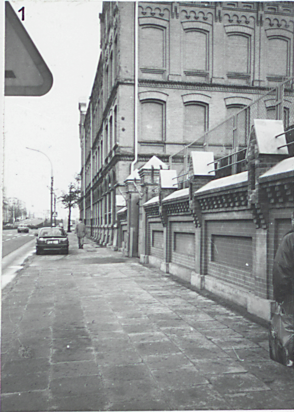
1. Widok ogrodzenia od str. połudn. ul. Kopcińskiego