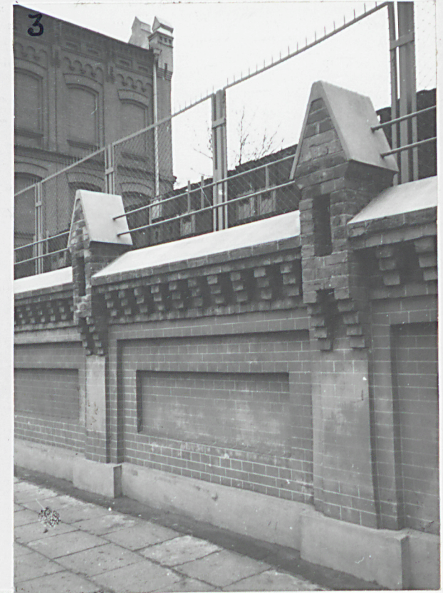
3. detal arch.