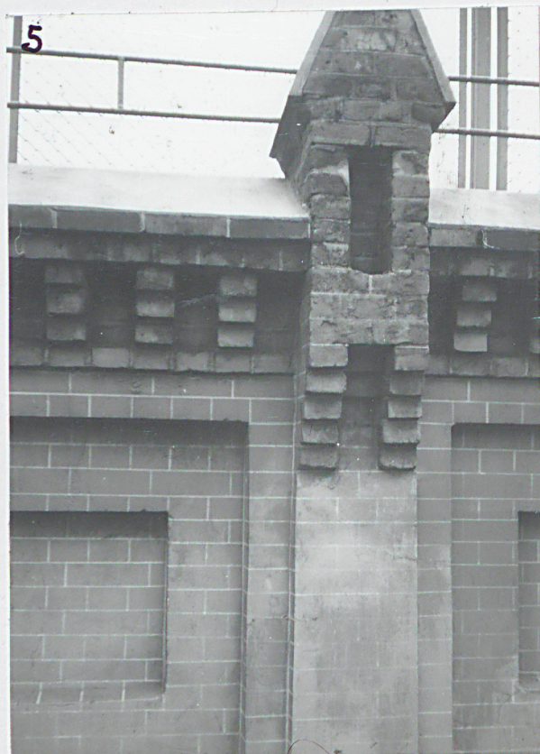
5. detal arch. ogrodzenia