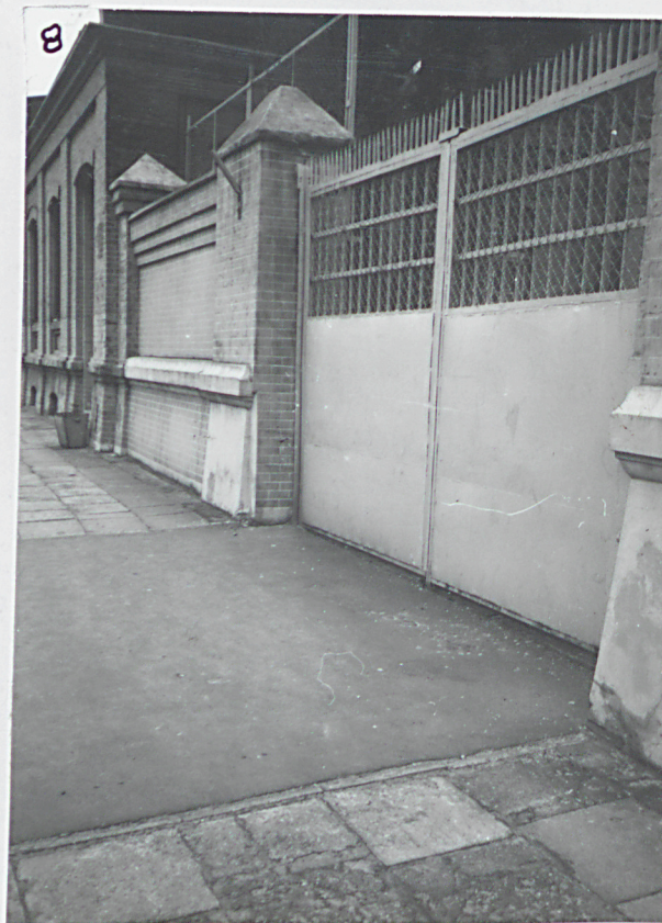
8. Wjazd południowy od ul. Kopcińskiego