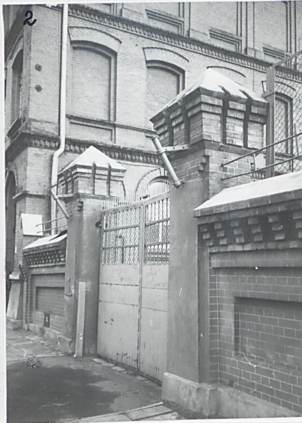
2. Wjazd północny od ul. Kopcińskiego