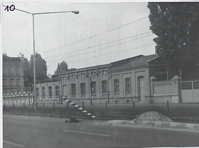
12 10. Widok ogólny na ogrodzenie