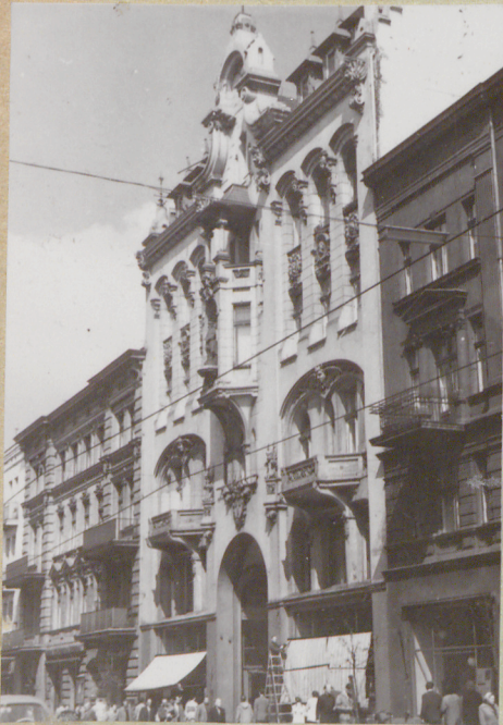
31. Szkic sytuacyjny, plan schematyczny, uwagi opisowe, fotografia

Z Y X W V U T S R P O N M L K J I H G F E D C B A Nr