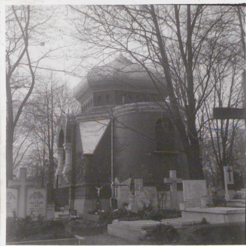
ELEWACJA POŁUDNIOWA I ZACHODNIA