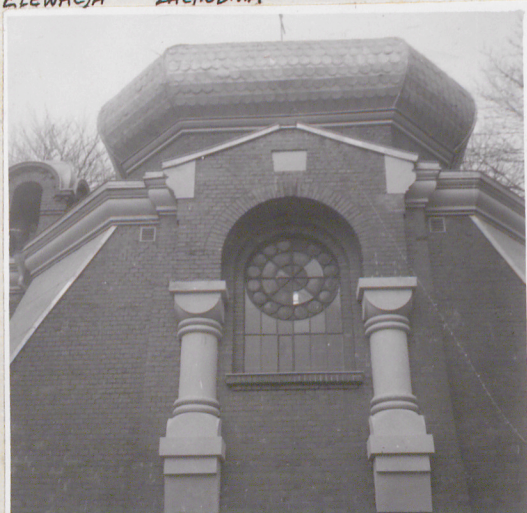
DETAL NA ELEWACJI POŁUDNIOWEJ - OKNO

Wkładkę założył: Elżbieta Posłuszny kwiecień 83 (imię, nazwisko, data)