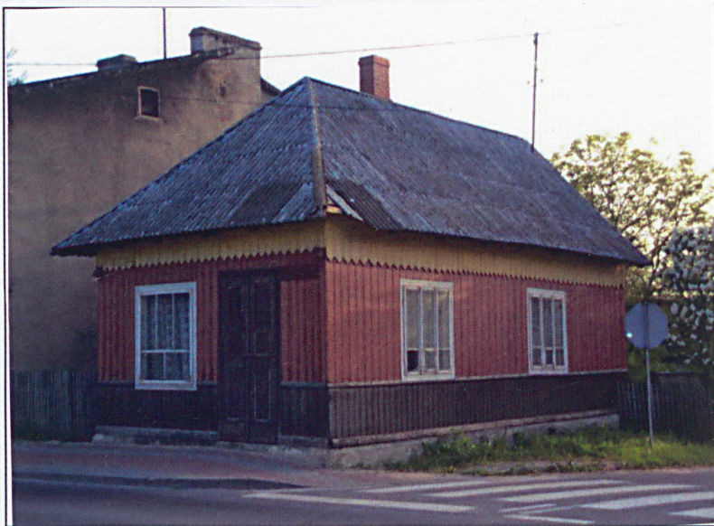
Inowłódz, pl. K. Wielkiego nr 2 - dom. Widok od północnego-zachodu