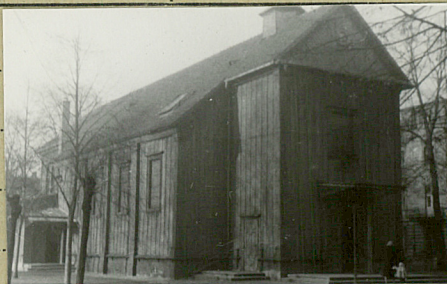
for. M. Pracasta 1959r.