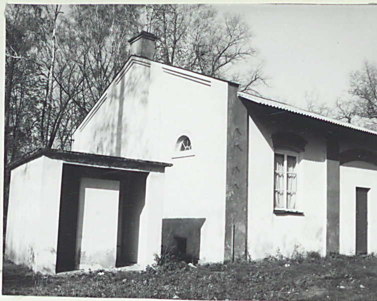
Fragment elewacji poł.-wsch. (nr neg.44/17)