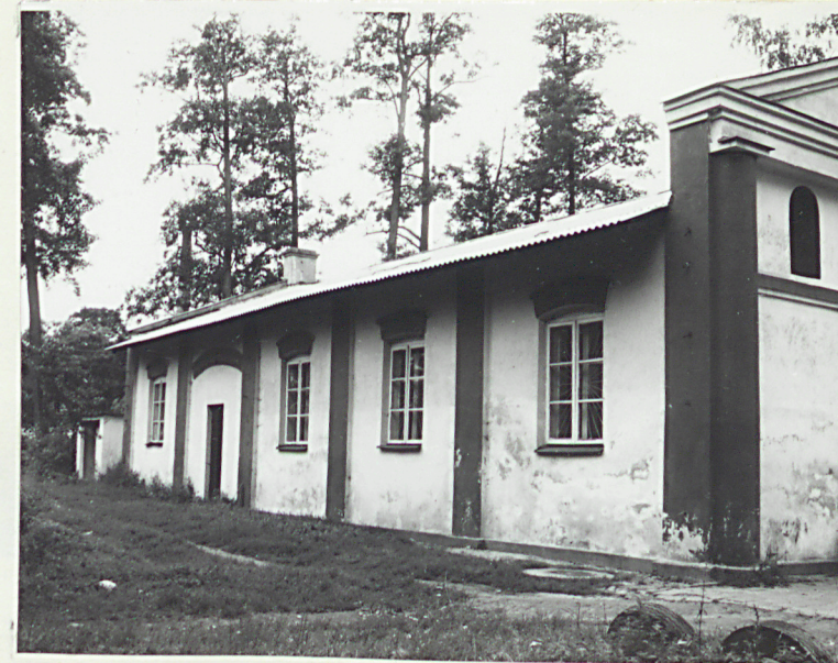
Elewacja wschodnia (nr neg.38/31)