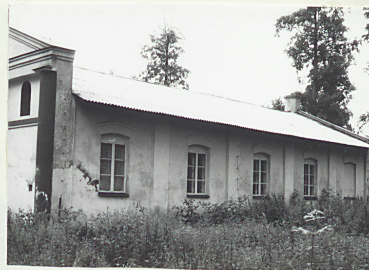
Elewacja zachodnia (nr neg.38/32)

Wkładkę założył: mgr Edward Traczyński, IX 1996 r., rys. i fot. techn. Julian Mróz (imię, nazwisko data)