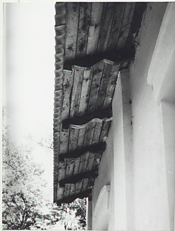
Fragment okapu dachu (nr neg.35/3)