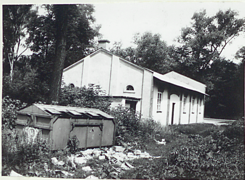
Elewacje poł.-wsch. (nr neg.35/8)