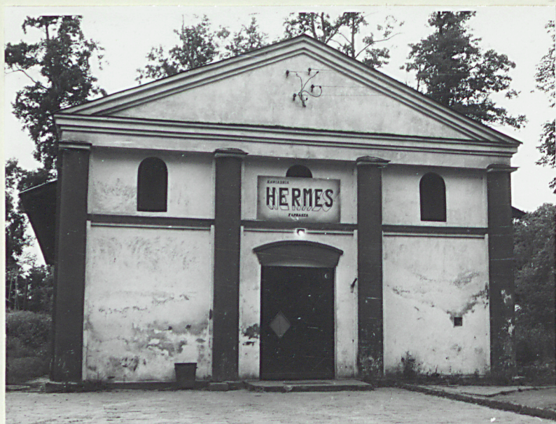
Elewacja północna (nr neg.38/33)