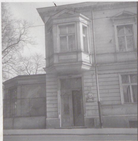
DETALE ELEWACJI PŁN. WEJŚCIE GŁ. I WYKŁOZ