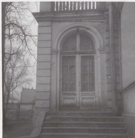
WYJŚCIE Z BUDYNKU PRZEZ PRZYBUDÓWKĘ OD ZACHODU