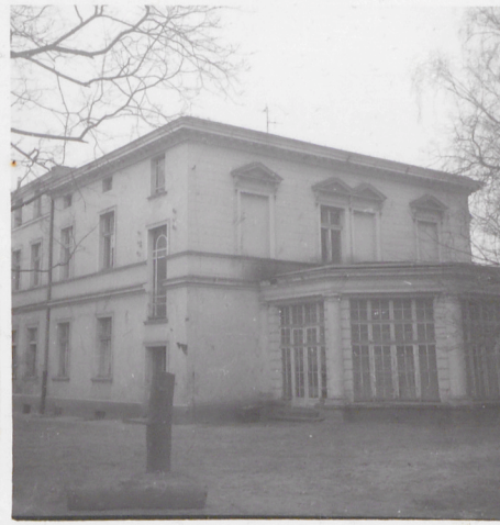
FRAGMENTY ELEWACJI PÓŁDNIOWEJ I WSCHODNIEJ