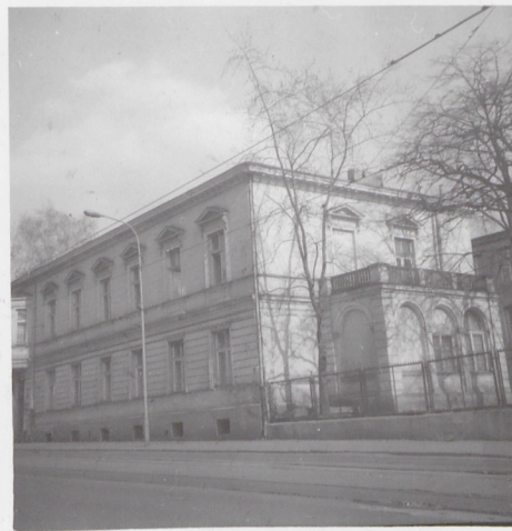
ELEWACJA PÓŁNOCNA I ZACHODNIA