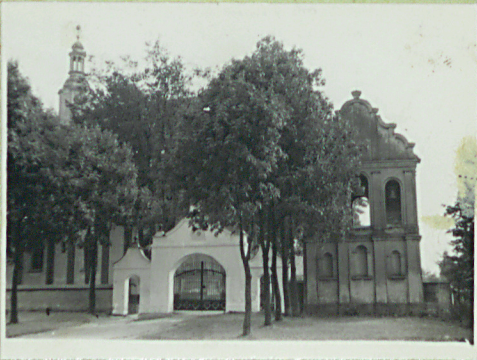
Późnobarokowa. Murowana. Czworohectowa, obni- kondygnacyjowa.