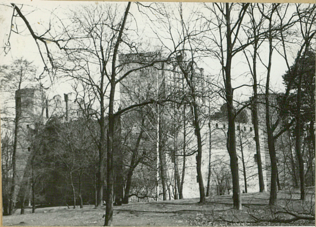
FOT. 1. J.H.